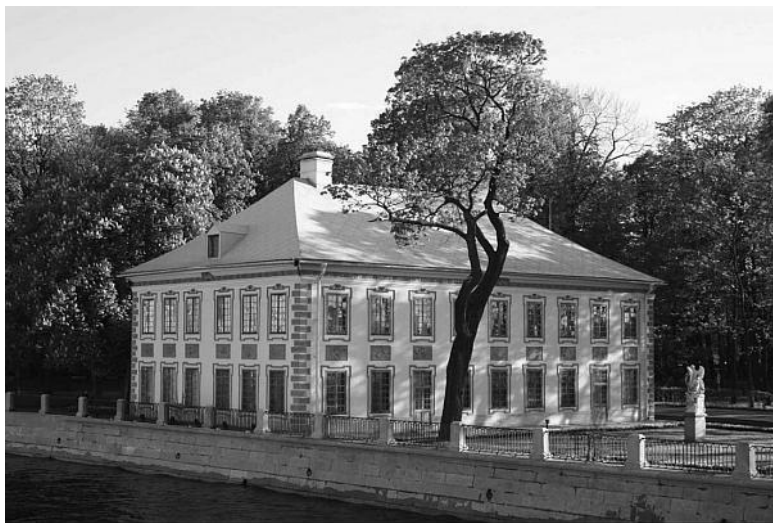
Летний дворец Петра I