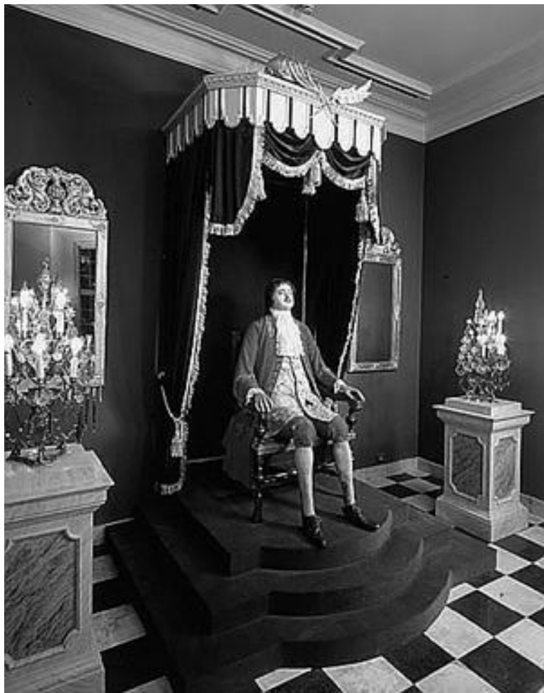
Зимний дворец Петра I. Фрагмент экспозиции