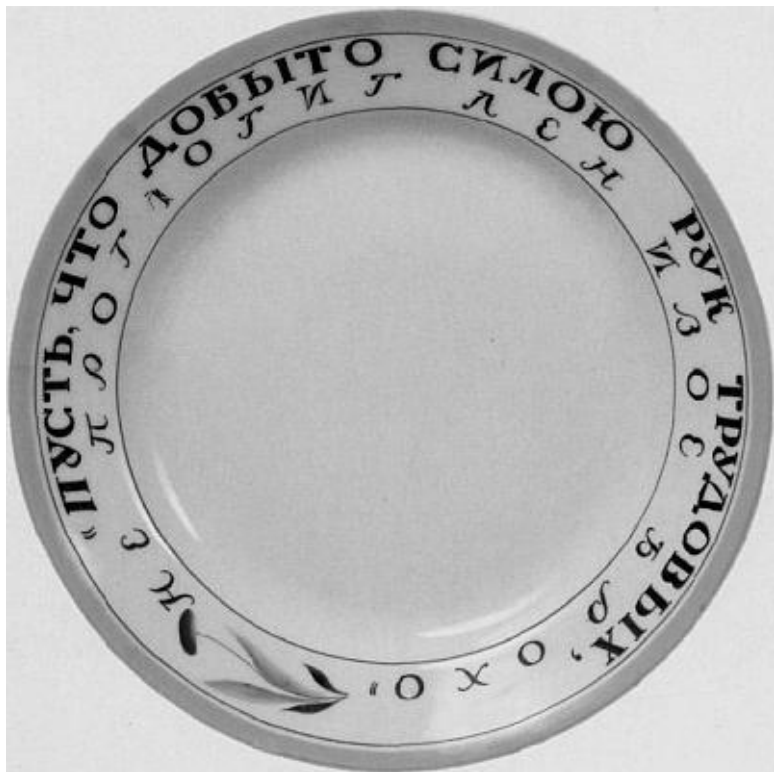
С. Чехонин. Тарелка. 1919 г.

Кроме художественного фарфора на заводе производился химический и технический фарфор, впервые здесь получено оптическое стекло. В 1925 г., в связи с 200-летием Российской академии наук, заводу присвоили имя гениального русского ученого М.В. Ломоносова.