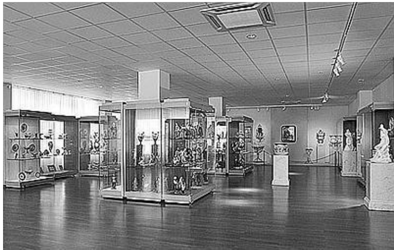
Фрагмент экспозиции музея Императорского фарфорового завода