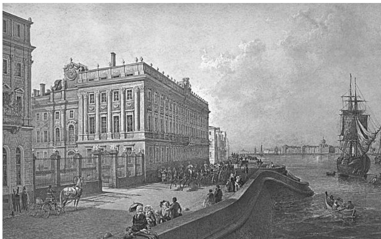
В.С. Садовников. Мраморный дворец, 1847 г.

В 1797–1798 гг. во дворце жил Станислав Понятовский – польский шляхтич, бывший фаворит Екатерины, последний польский король и великий князь литовский. После его смерти во дворце снова поселился Константин Павлович, покинувший дворец после войны 1812 г., чтобы стать наместником в царстве Польском.