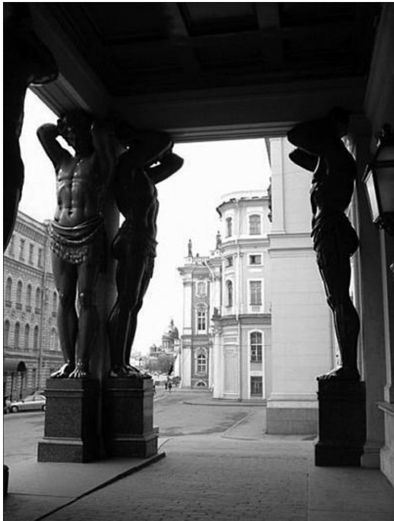
Атланты Нового Эрмитажа