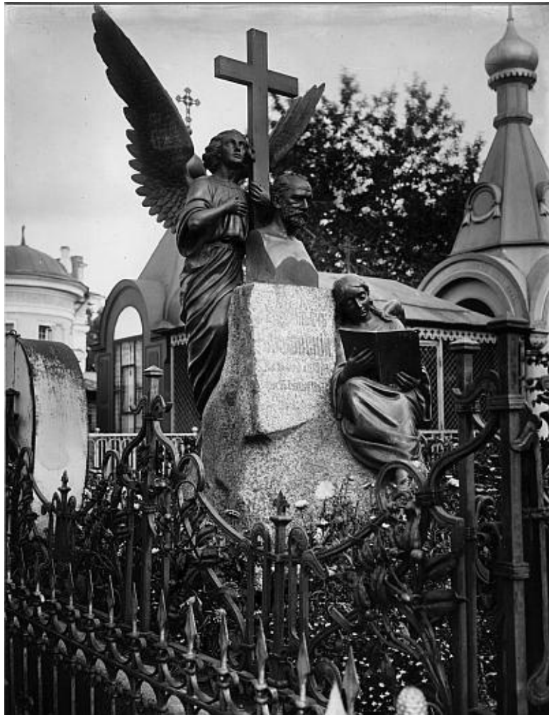
Надгробие П.И. Чайковского на Тихвинском кладбище