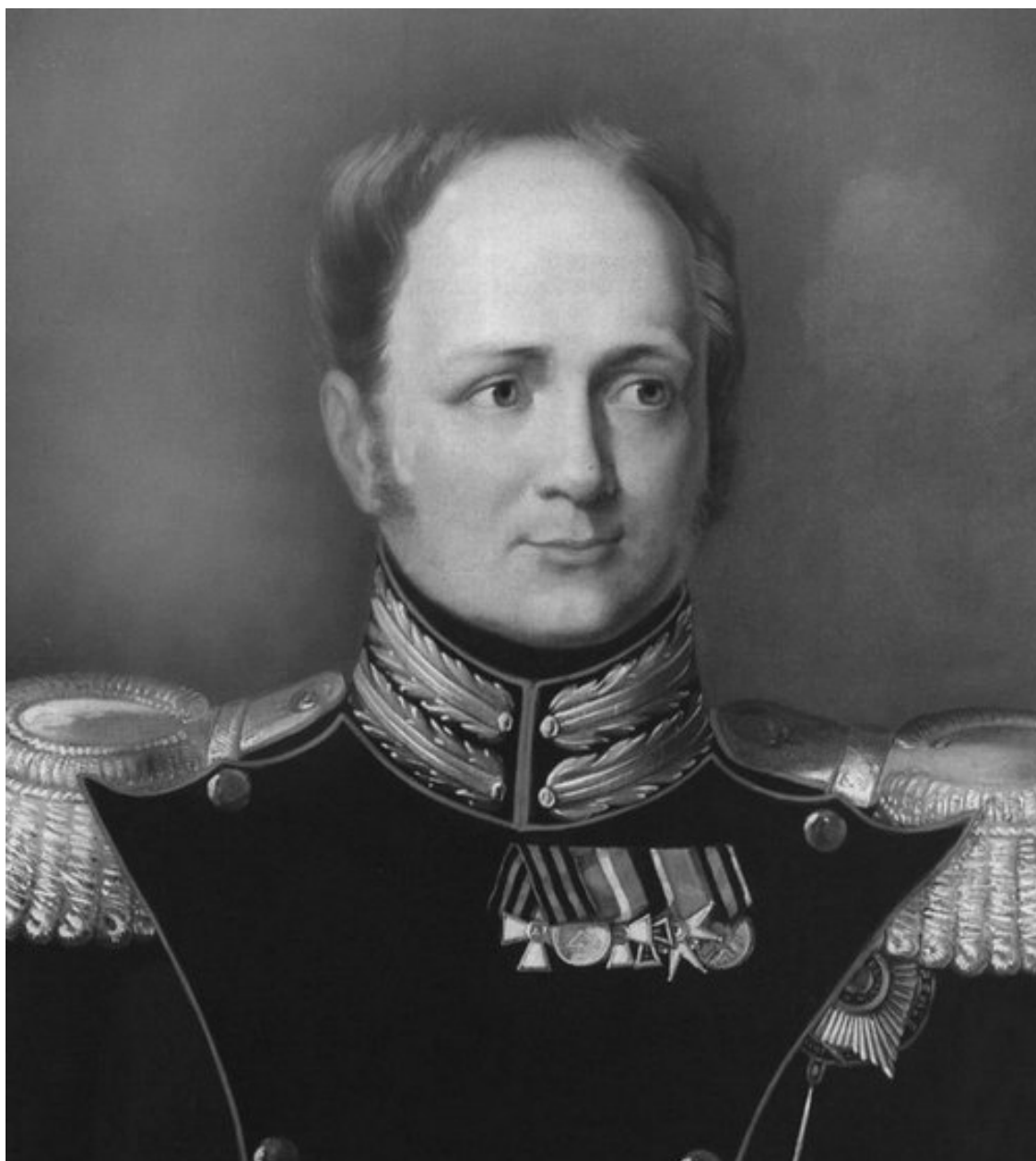
Дж. Доу. Император Александр I. Первая четверть XVIII в.

Чтобы исключить малейшую небрежность в прикреплении к очередному мундиру императора в нужном порядке знаков орденов, отобранных для ношения в орденской колодке, требовалось достаточное количество их комплектов. Порядок соседствования в орденской колодке Александра I отечественных военных наград с пожалованиями западноевропейских союзников по антинаполеоновским коалициям 54 сложился полностью к 1815 году.