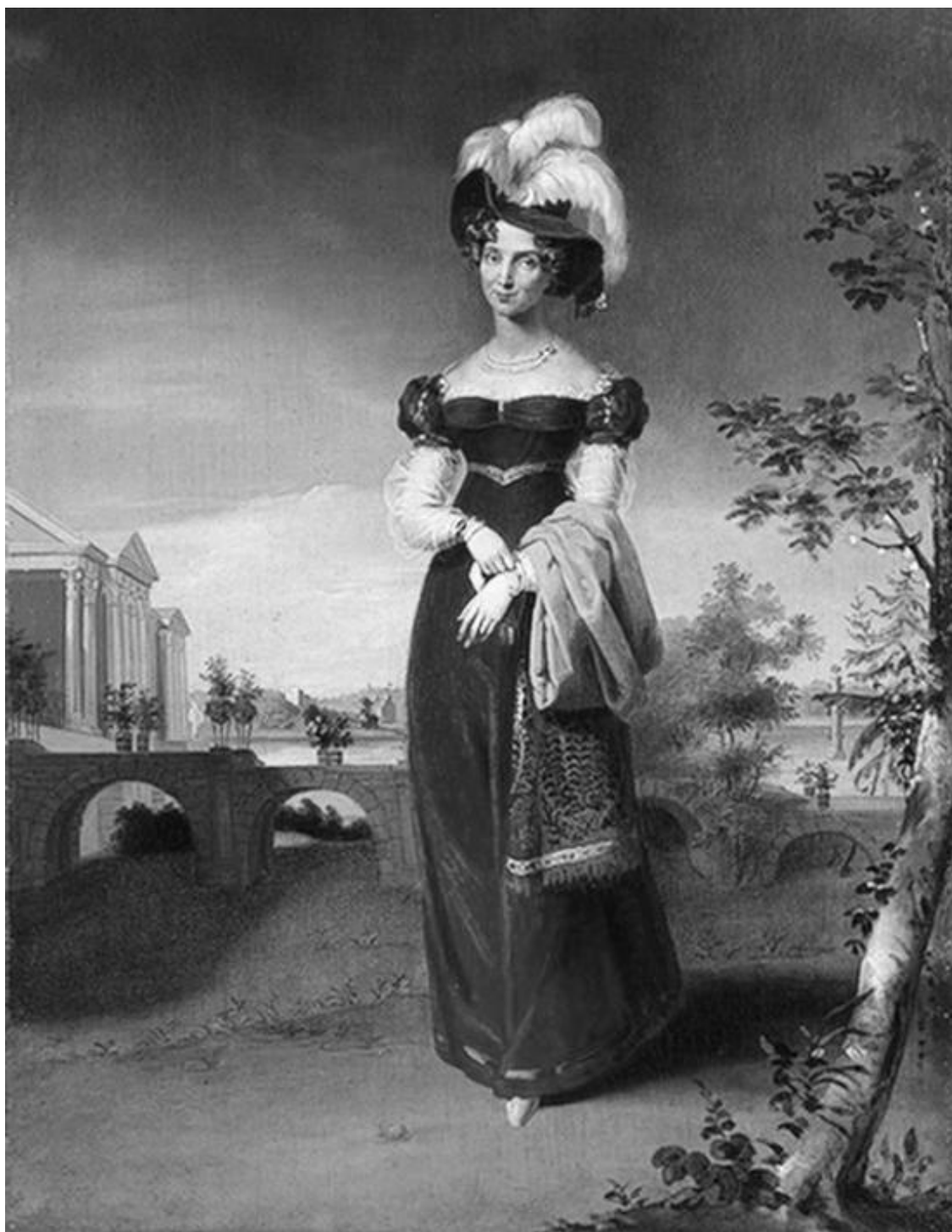
Неизвестный художник. Императрица Елизавета Алексеевна на прогулке в парке Царского Села. Начало XIX в.

Александр I при случае не упускал декларировать: «Любовь любезного мне народа есть моя лучшая награда» и «составляет для меня единственный предмет, начало и конец всех моих действий и желаний», причем «покой и счастье народа... считаю я драгоценнейшим залогом, от провидения мне врученным, и важнейшею обязанностью моей жизни» 37 . Достойный внук мудрой Екатерины II хорошо помнил истину, что дорогие подарки делают сердца подданных