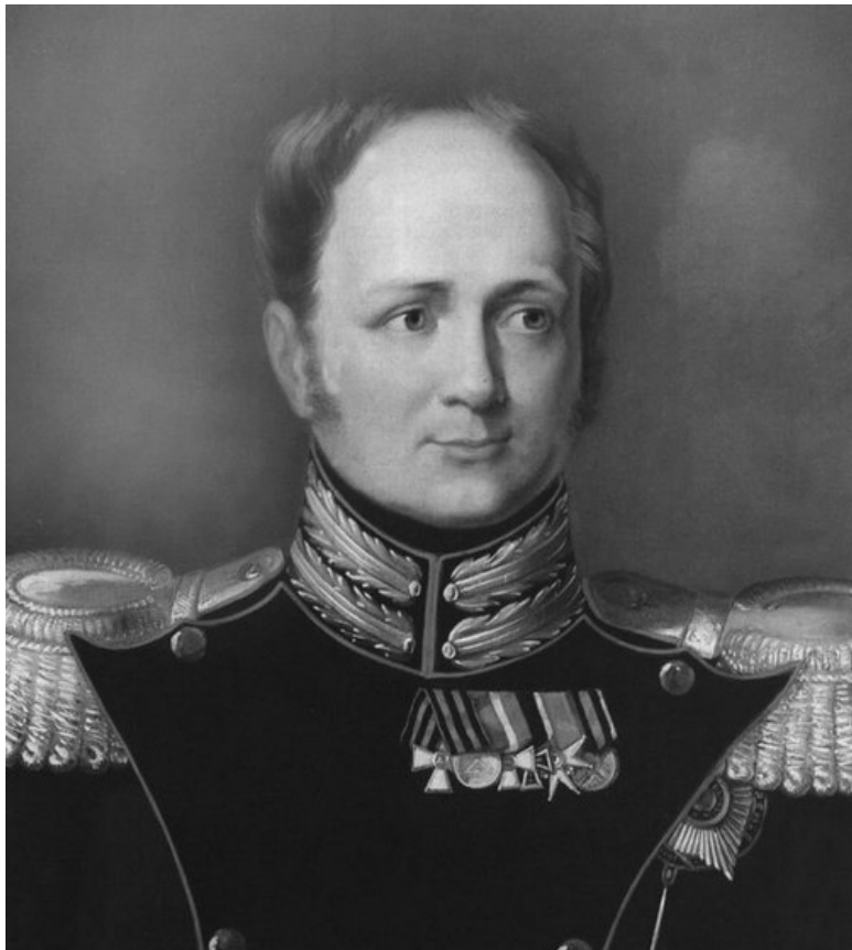
Дж. Доу. Император Александр I. Первая четверть XVIII в.

Чтобы исключить малейшую небрежность в прикрепле-