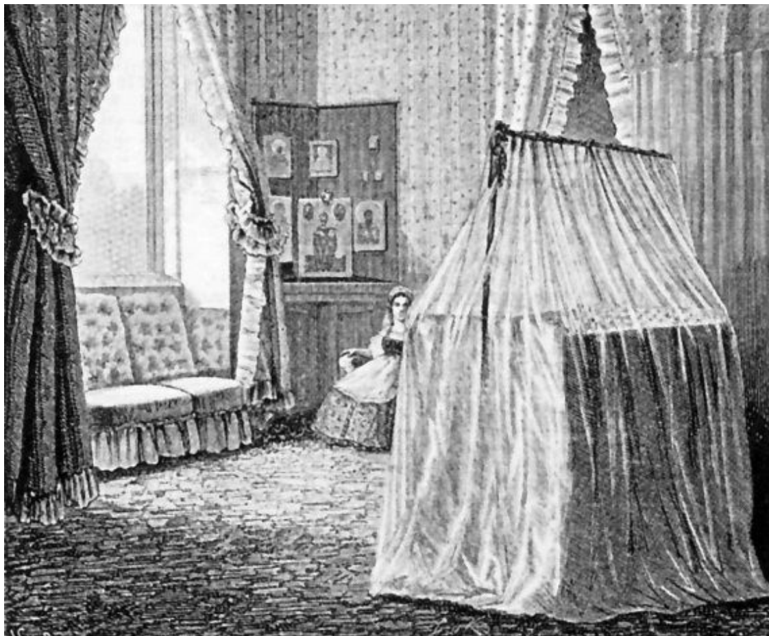
Спальня Ники в Аничковом дворце