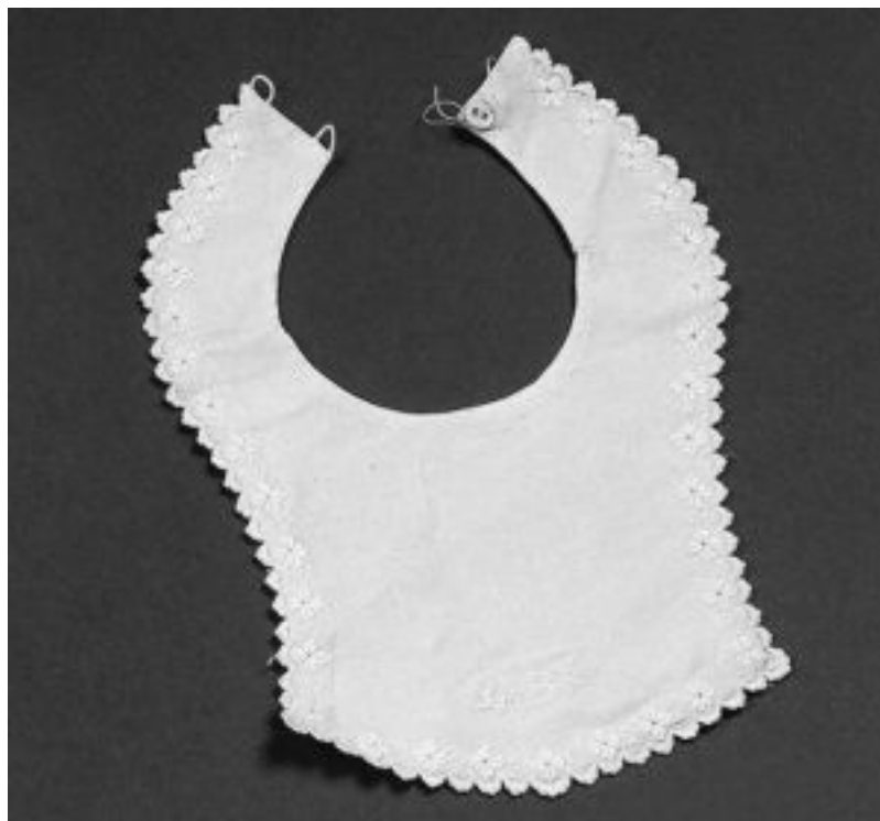
Нагрудники детские. 1900-е гг.

При рождении Михаила, последнего сына Павла I, эта традиция была ликвидирована. «Повседневный» вариант предполагал роскошный русский традиционный сарафан с кокошником. Эта «форма» соблюдалась при Дворе вплоть до 1917 г. Поскольку «русские» сарафаны