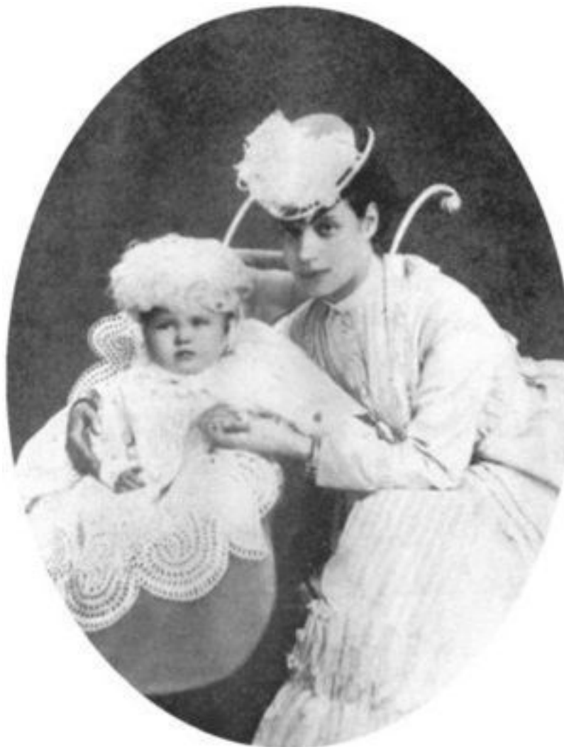
Имп. Мария Федоровна с сыном Николаем. Осень 1868 г.

Таким образом, рождение сыновей в императорской семье имело не только характер обычной человеческой радости, но и становилось событием большого политического значения, создавая запас прочности правящей династии.