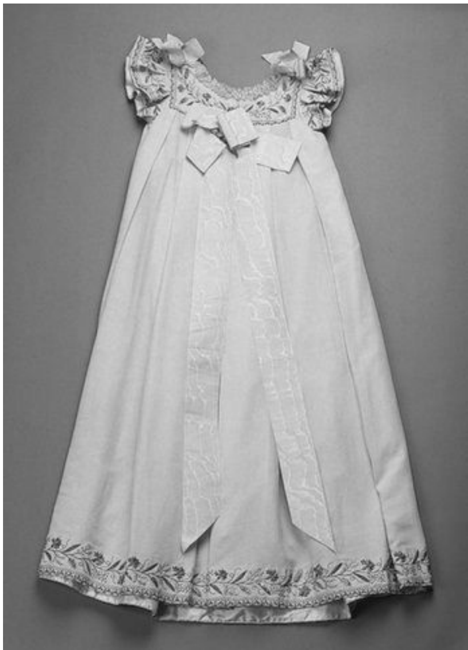
Платье для младенца. 1900-е гг.