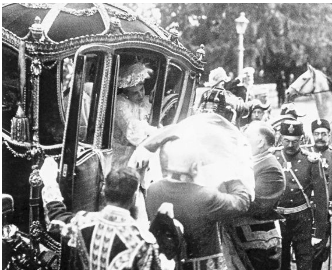
День крещения цесаревича Алексея 11 августа 1904 г. Прибытие новорожденного