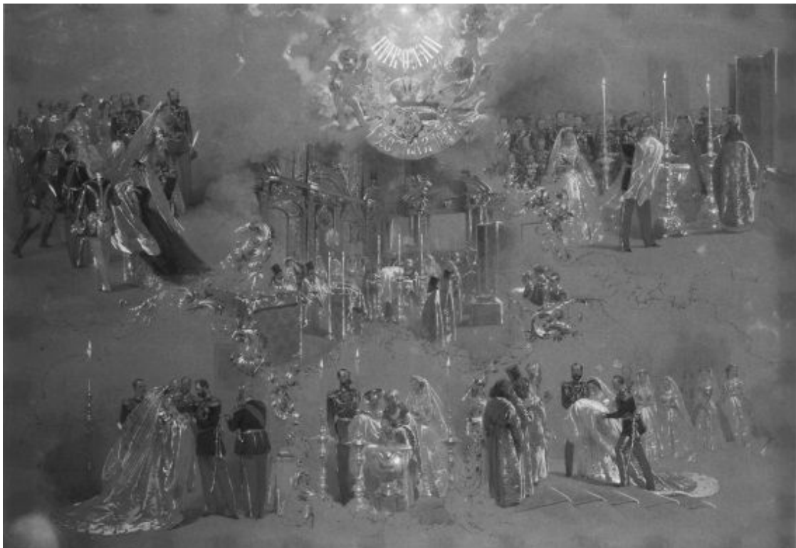
М. Зичи. Крещение вел. кн. Николая Александровича. 1868 г.

Примечательно, что во время крещения в качестве ассистентов статс-дамы выступали два императора – Александр II и отец – великий князь Александр Александрович (будущий) Александр III. То, что отец, нарушая традиции, принимал активное участие в крещении, видимо, было связано с важностью происходящего. Два императора, действующий и потенциальный, держали на руках своего очередного преемника, укрепляя фундамент его легитимности.