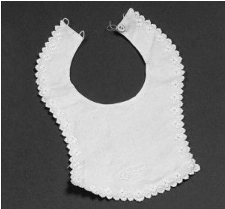
Нагрудники детские. 1900-е гг.

При рождении Михаила, последнего сына Павла I, эта традиция была ликвидирована. «Повседневный» вариант предполагал роскошный русский традиционный сарафан с кокошником. Эта «форма» соблюдалась при Дворе вплоть до 1917 г. Поскольку «русские» сарафаны были дорогими и ши-