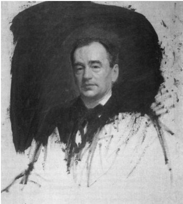
И.Н. Крамской. Портрет доктора К.А. Раухфуса. 1887 г.

В августе 1896 г. должность врача при детях Николая II занял почетный лейб-педиатр доктор И.П. Коровин. До это-