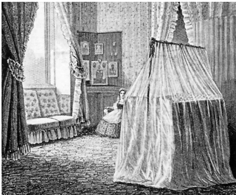
Спальня Ники в Аничковом дворце

Когда в России, начале 1840-х гг. ассигнации пересчитали на серебро, то пересчитали и деньги дочерей «умершей кормилицы». Анна и Авдотья стали «за поздравления» получать 14 руб. 28 \frac{4}{7} коп. на двоих.