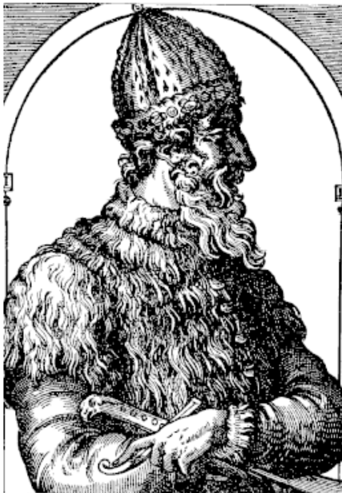
Великий князь Московский Иван III Васильевич. Гравюра XVII в.

других частей города. «В действительности московская местность представляла в первое время много сельских удобств для основания широкого сельского хозяйства. Так называемый Великий луг Замоскворечья, лежавший против кремлевской горы, доставлял обширное пастбище для скота и особенно для княжеских конских табунов» 5 , – пишет И.Е. Забелин в «Истории города Москвы».