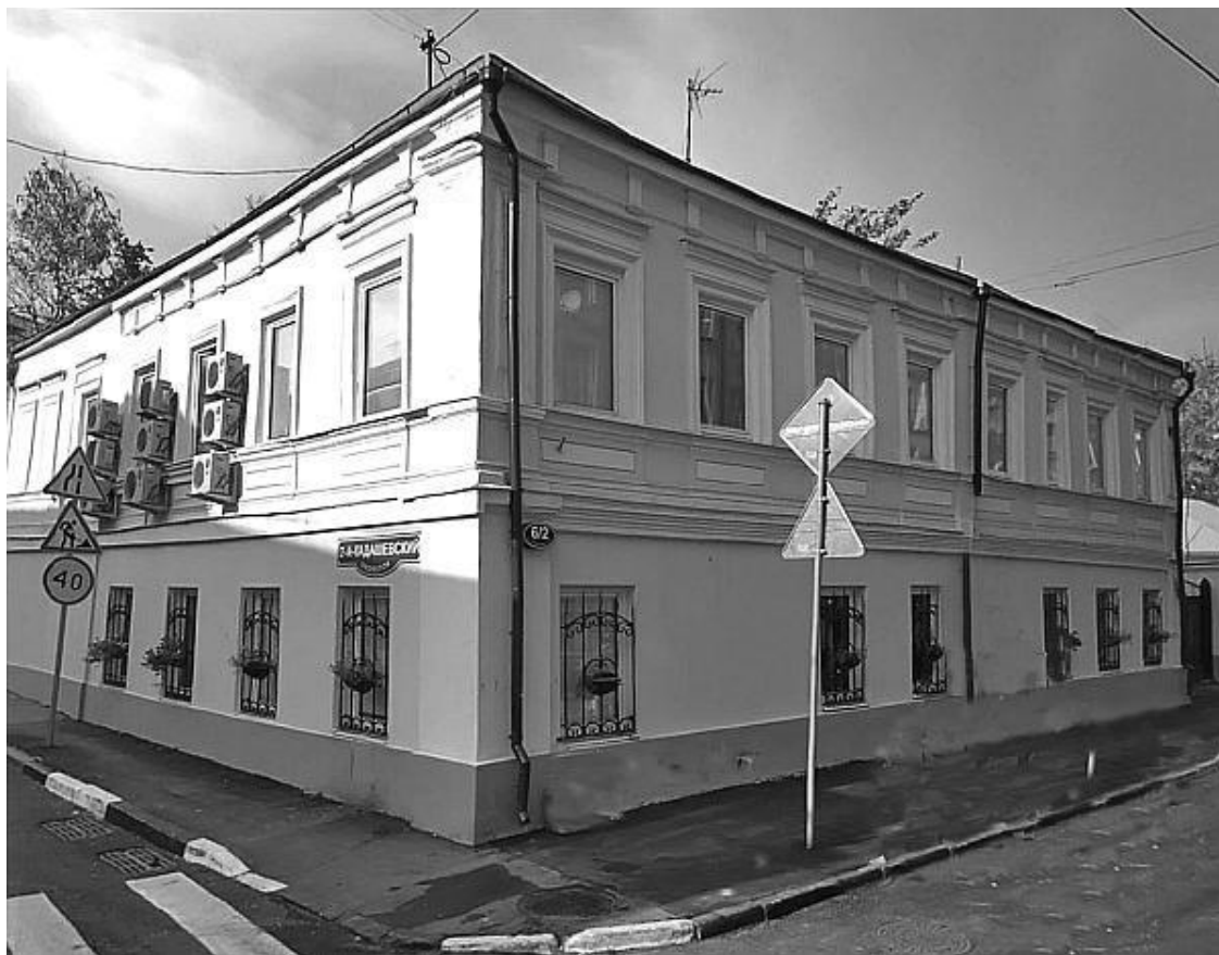
Большая Ордынка, № 6. Современная фотография

Но вот мы оказались на углу Большой Ордынки и Кадашевского переулка. Тут нас ждет новое открытие – прогулка по московской слободе. Издавна говорили, что Замоскворечье имеет совсем особенный характер . Замоскворечье состояло из множества слобод – отдельных поселков с самостоятельным управлением и своеобразным бытом. Каждая слобода, в свою очередь, также имела свой особенный характер. Слобода (неправильно произнесенное слово «свобода») – это поселение, свободное от государственных повинностей. М.В. Горбаневский в книге «Москва: кольца столетий» пишет: «К XVI – XVII векам слово слобода уже приобрело более общее значение: «поселок, пригород, селение подле города». В слободах проживали по преимуществу люди одной профессии, одних занятий, промыслов. Если мы взглянем на современную карту Москвы, то заметим, что слово слобода дошло до наших дней в составе нескольких топонимов – в столице есть улица Сокольническая Слободка, улица Штатная Слобода и Новослободская улица, а также Каменнослободский переулок» 32 .