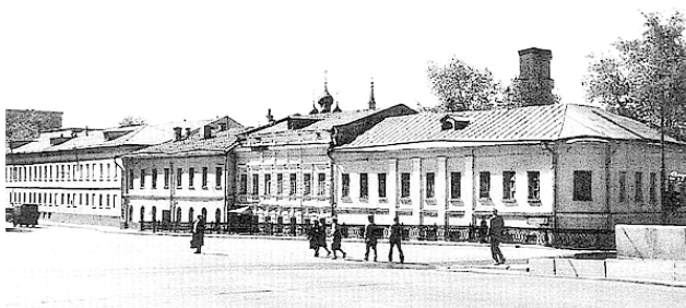
Начало Большой Ордынки. Фотография 1988 г.

Когда в России многопьющей Вам скажут слово «вездесущий», — Не разумейте Бога в нем: Так начали во время Грота (Сего грядущего банкрота) Именовать «питейный дом».