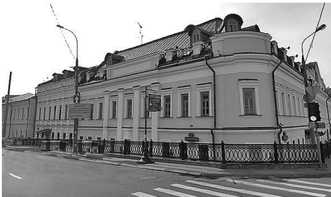
Большая Ордынка, № 2. Современная фотография

В XIX веке питейный дом на Большой Ордынке снесли, потому что его вид, а главное – поведение людей, посещающих его, не соответствовали высоким требованиям главной улицы Замоскворечья. На месте кабака построили двухэтажное здание с пилястровым портиком и скругленной угловой частью. А новое питейное заведение появилось тут же по соседству, впри- тык к первому зданию. Сейчас его фасад практически идентичен фасаду XIX века. Впоследствии эти два дома были объединены и имели один адрес – Большая Ордынка, № 2. В 1996 году была произведена реконструкция углового здания и дома № 32 по Кадашевской набережной. От построек XIX века практически ничего не осталось. Теперь здесь красуется трехэтажный, с мансардами, аттиками и пилястровым портиком бизнес-центр класса «А» «Кадашевская слобода», имеющий очень привлекательный и респектабельный вид.