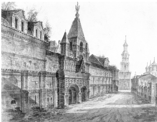
Вид в Замоскворечье на Кадашевский Хамовный двор и колокольню церкви Космы и Дамиана. 1800-е гг. Художник Ф.Я. Алексеев

Во время Петровских реформ облик Замоскворечья меняется. Петр подавил стрелецкий бунт и расформировал стрелецкое войско. Часть стрельцов была казнена, другие распределены по разным полкам. Их земли были отданы военным, купцам и мелким чиновникам. Когда столицей России становится Петербург, ремесленники и жители слобод (садовники, овчинники, кузнецы и монетчики) теряют своего главного заказчика – царский двор и практически лишаются источника существования. «На Пятницкой улице появляются дворы богачей, деревянные хоромы которых скрывались за выходившими на улицу заборами и садами. Однообразие замоскворецкого пейзажа нарушалось красивыми церквями, выстроенными купцами и еще ранее стрельцами» 12 , – пишет П.В. Сытин в книге «Из истории московских улиц».