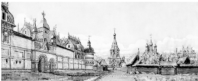
Кадашевский ткацкий двор. Художник М.П. Кудрявцев

В XVII веке в Кадашевской слободе жили уже не бондари, а ткачи, производившие льняное полотно. Тогда по всей Москве возникали мощные объединения ремесленников с собственным центром, появлялись первые мануфактуры и мелкая промышленность. Царский двор был заинтересован в продукции, выпускаемой этими объединениями. Благодаря развитию в стране торговых связей образуется всероссийский рынок. К концу XVII века Москва становится ремесленной и торговой.