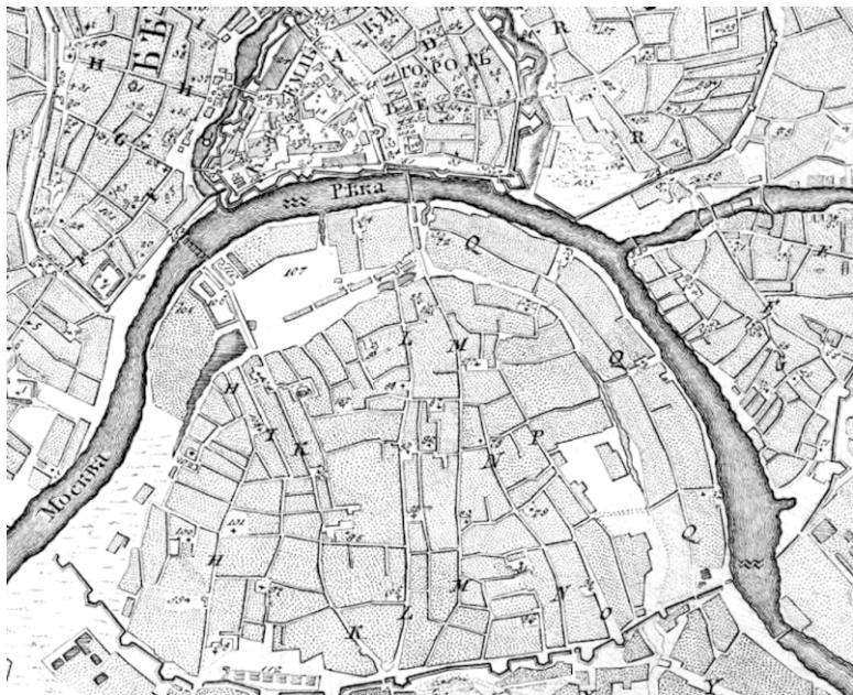
План Москвы архитектора Ивана Мичурина. 1739 г. Фрагмент

Хоть Замоскворечье и было полноценной частью города, в нем оставались некоторые патриархальные особенности и приверженность к старым традициям. Это выразилось в том числе и в архитектуре. Большинство церквей, построенных здесь в XVII веке (Николы в Берсеневке, Николы в Пыжах, Георгия в Ендове), обладают одинаковым композиционным началом, сложностью силуэта и богатством декора. Замоск-