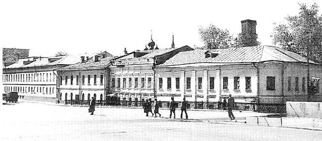
Начало Большой Ордынки. Фотография 1988 г.

Фартины, трактиры, герберги, ресторации, ренсковые погреба – каких только разных названий кабаков не было в Москве! Одно из таких заведений встречало всех приходящих и приезжающих из центральных районов Москвы на Большую Ордынку. Трудно было устоять перед соблазном зайти. А как замоскворецкие купцы любили «питейные дома» – это отдельная история. И вот уже Ольга Дмитриевна Потапова, молодая жена купца из пьесы А.Н. Островского «Сердце не камень», жалуется подруге: «Я шла замуж-то, как голубка была, а муж меня через неделю по трактирам повез арфисток слушать; сажал их за один стол со мной, обнимался с ними; а что говорили, так у меня волосы дыбом подымались!» 27