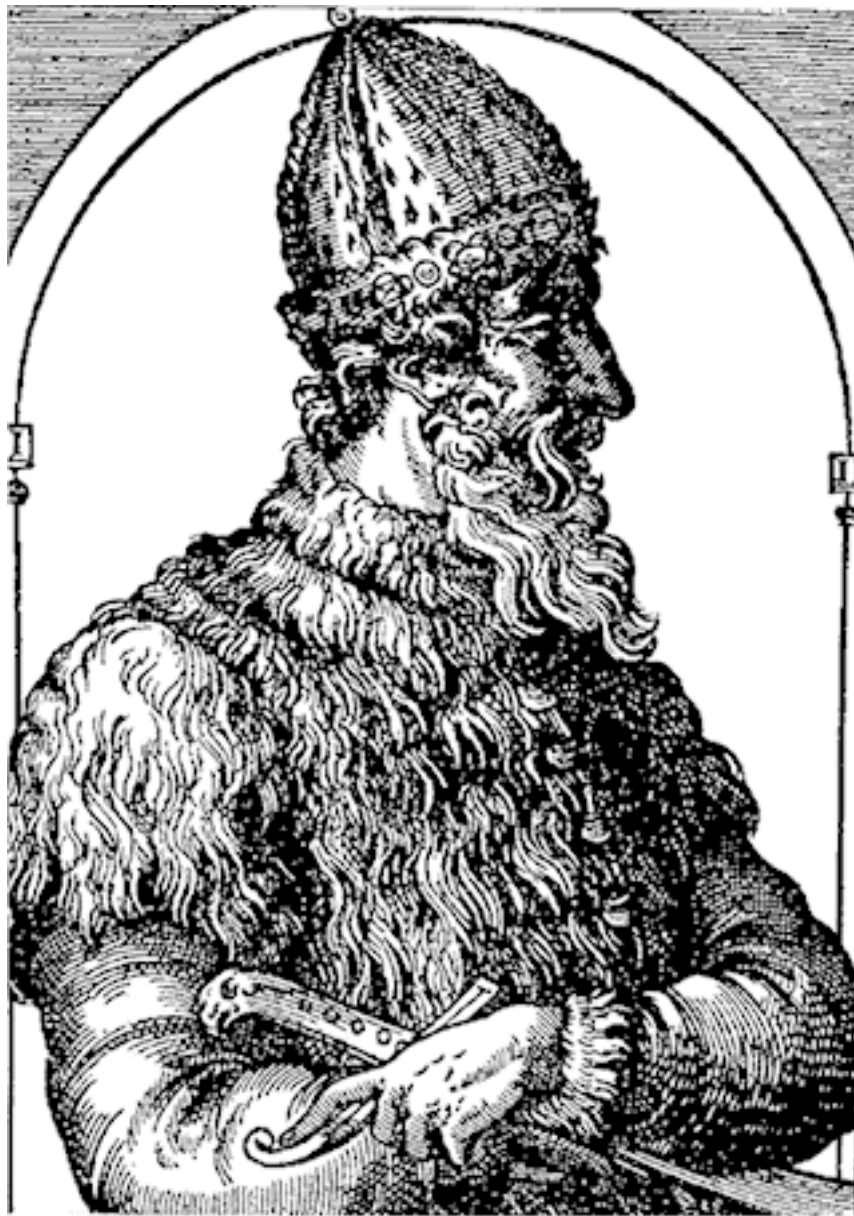
Великий князь Московский Иван III Васильевич. Гравюра XVII в.

других частей города. «В действительности московская местность представляла в первое время много сельских удобств для основания широкого сельского хозяйства. Так называемый Великий луг Замоскворечья, лежавший против кремлевской горы, доставлял обширное пастбище для скота и особенно для княжеских конских табунов» 5 , – пишет И. Е. Забелин в «Истории города Москвы».