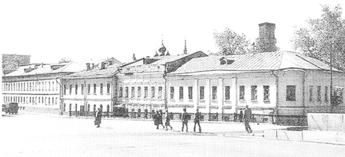
Начало Большой Ордынки. Фотография 1988 г.

Фартины, трактиры, герберги, ресторации, ренсковые погреба – каких только разных названий кабаков не было в Москве! Одно из таких заведений встречало всех проходящих и приезжающих из центральных районов Москвы на Большую Ордынку. Трудно было устоять перед соблазном зайти. А как замоскворецкие купцы любили «питейные дома» – это отдельная история. И вот уже Ольга Дмитриевна Потапова, молодая жена купца из пьесы А. Н. Островского «Сердце не камень», жалуется подруге: «Я шла замуж-то, как голубка была, а муж меня через неделю по трактирам повез арфисток слушать; сажал их за один стол со мной, обнимался с ними; а что говорили, так у меня волосы дыбом подымались!» 27