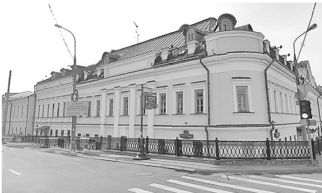
Большая Ордынка, № 2. Современная фотография

В XIX веке питейный дом на Большой Ордынке снесли, потому что его вид, а главное – поведение людей, посещающих его, не соответствовали высоким требованиям главной улицы Замоскворечья. На месте кабака построили двухэтажное здание с пилястровым портиком и скругленной угловой частью. А новое питейное заведение появилось тут же по соседству, впри- тык к первому зданию. Сейчас его фасад практически идентичен фасаду XIX века. Впослед- ствии эти два дома были объединены и имели один адрес – Большая Ордынка, № 2. В 1996 году была произведена реконструкция углового здания и дома № 32 по Кадашевской набережной. От построек XIX века практически ничего не осталось. Теперь здесь красуется трехэтажный, с мансардами, аттиками и пилястровым портиком бизнес-центр класса «А» «Кадашевская сло- бода», имеющий очень привлекательный и респектабельный вид.