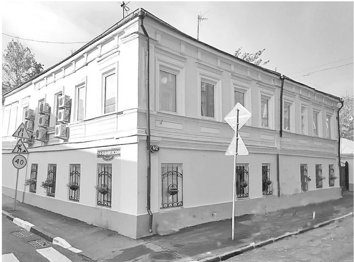
Большая Ордынка, № 6. Современная фотография

Но вот мы оказались на углу Большой Ордынки и Кадашевского переуллка. Тут нас ждет новое открытие – прогулка по московской слободе. Издавна говорили, что Замоскворечье имеет совсем особенный характер . Замоскворечье состояло из множества слобод – отдельных поселков с самостоятельным управлением и своеобразным бытом. Каждая слобода, в свою очередь, также имела свой особенный характер. Слобода (неправильно произнесенное слово «свобода») – это поселение, свободное от некоторых государственных повинностей. М. В. Горбаневский в книге «Москва: кольца столетий» пишет: «К XVI–XVII векам слово слобода уже приобрело более общее значение: «поселок, пригород, селение подле города». В слободах проживали по преимуществу люди одной профессии, одних занятий, промыслов. Если мы взглянем на современную карту Москвы, то заметим, что слово слобода дошло до наших дней в составе нескольких топонимов – в столице есть улица Сокольническая Слободка, улица Штатная Слобода и Новослободская улица, а также Каменнослободский переулок» 32 .