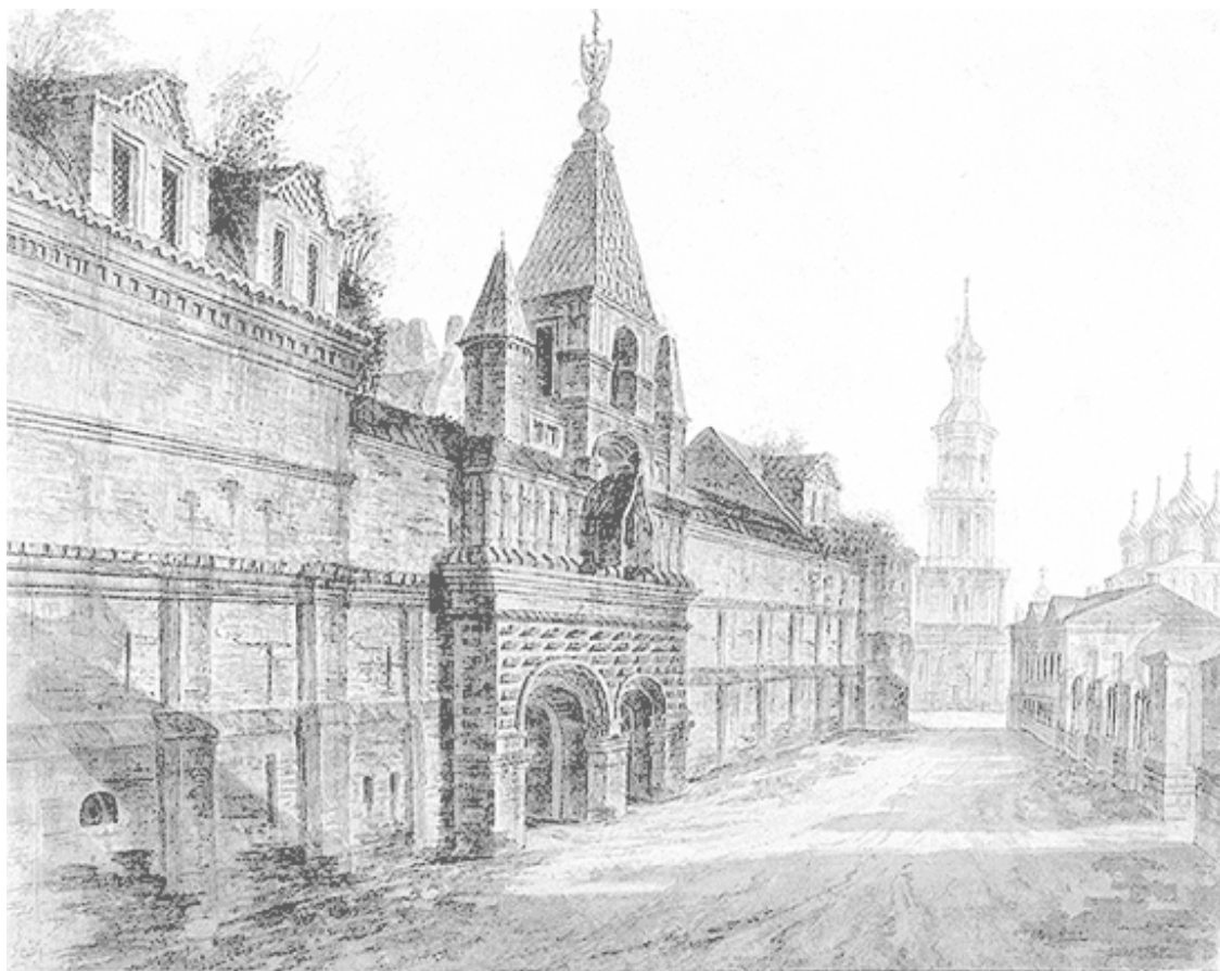
Вид в Замоскворечье на Кадашевский Хамовный двор и колокольню церкви Космы и Дамиана. 1800-е гг. Художник Ф. Я. Алексеев

лицей России становится Петербург, ремесленники и жители слобод (садовники, овчинники, кузнецы и хамовники) теряют своего главного заказчика – царский двор и практически лишаются источника существования. «На Пятницкой улице появляются дворы богачей, деревянные хоромы которых скрывались за выходившими на улицу заборами и садами. Однообразие замоскворецкого пейзажа нарушалось красивыми церквями, выстроенными купцами и еще ранее стрельцами» 12 , – пишет П. В. Сытин в книге «Из истории московских улиц».