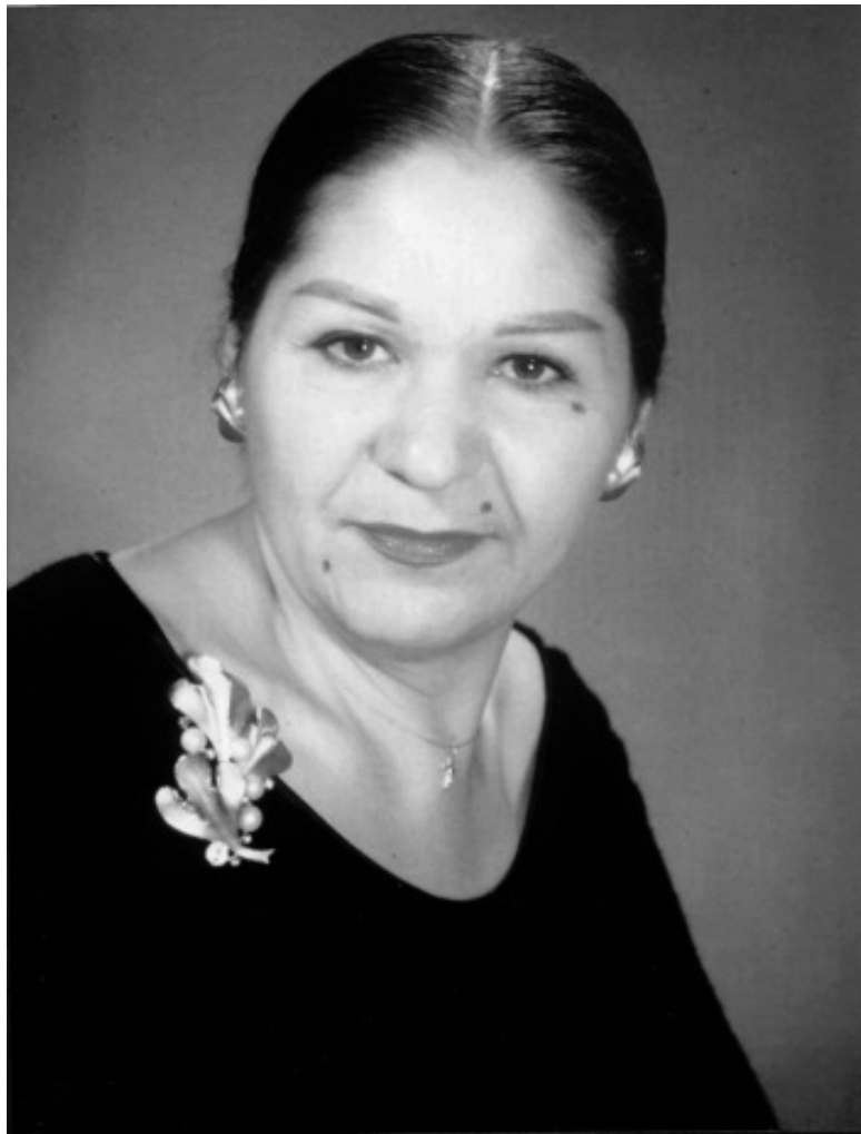
Джоэл Мари Тойч