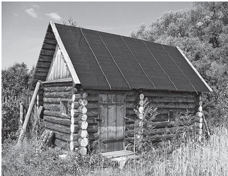
Иллюстрация 1. Современная версия деревенской бани “по-черному”. Новгородская область, 2004 год.

Современный мир осознал, как опасны микробы и как важно от них избавляться. Представление о том, что баня очищает от грязи, прогоняет заразу и укрепляет телесное здоровье, укоренилось очень глубоко. Крестьянская поговорка гласила: “Баня любую болезнь из тела гонит”, однако лишь в конце XVIII века гигиена оказалась в фокусе государственного внимания в имперской России. Лейб-медик Ека-