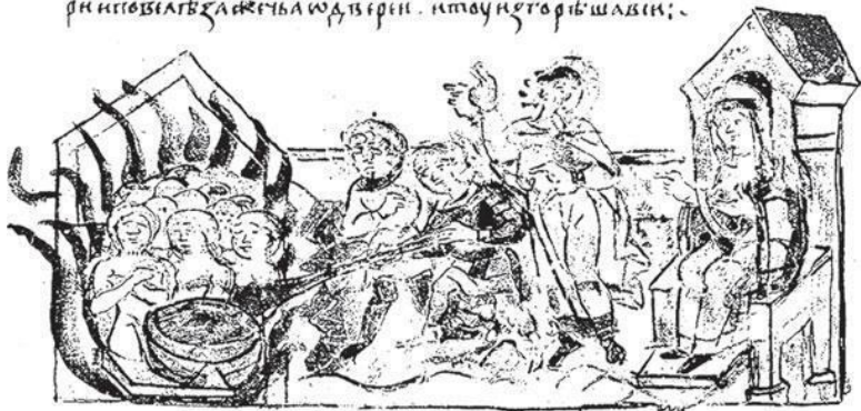
Иллюстрация 4. Ольга сжигает древлян в бане около 945 г. н. э. Миниатюра из Радзивилловской летописи, копия XV века с оригинала XIII века.

и не похвалитъ за жгътьѣмъ дѣренъ. и тоу не говорѣшамъ:~