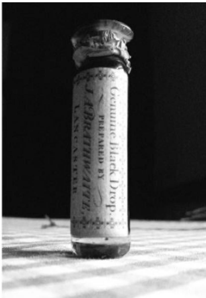
Склянка «черных капель Кендала», популярной тинктуры, беспрепятственно продававшейся аптекарями в позднегеоргианскую эпоху

Употребление опиума вовсе не было привилегией высших классов. Де Квинси утверждал, что в родном его Манчестере рабочий люд так быстро пристрастился к опиуму, что субботним вечером аптекари рядами выкладывали на прилавок пилюли в один, два и три грана, готовясь к неизбежному вечернему наплыву посетителей.