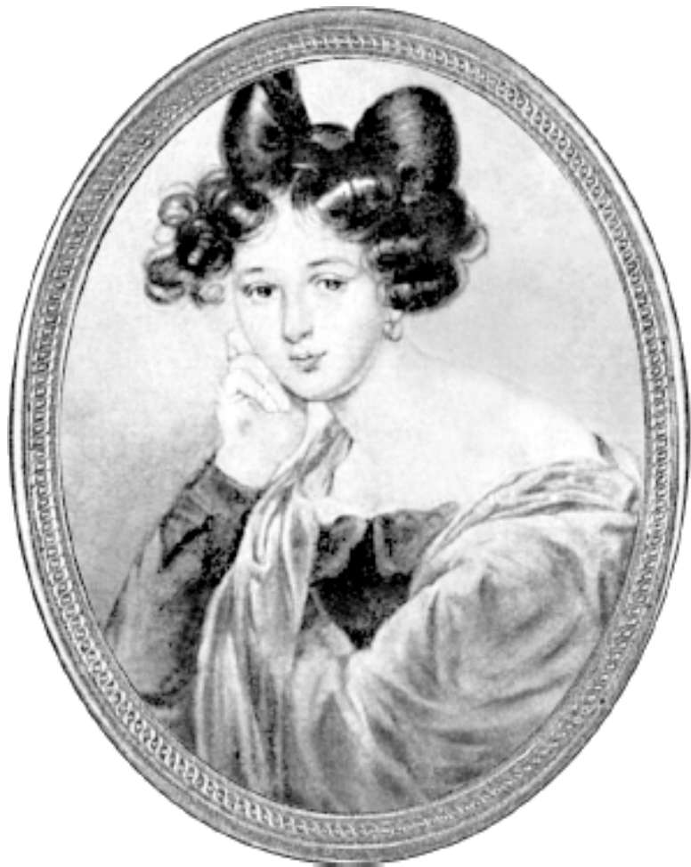
Элеонора Ф. Тютчева, первая жена поэта.