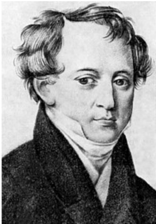
Н. И. Тютчев.

Парные портреты работы неизвестного художника.