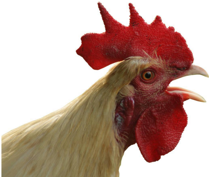
Рисунок 12 Петух голосит

Молодые петухи Из-за хлебной крошки Подрались немножко. Я советую как друг, Петушкам сказал Индюк, В драку зря не лезьте, А играйте вместе.