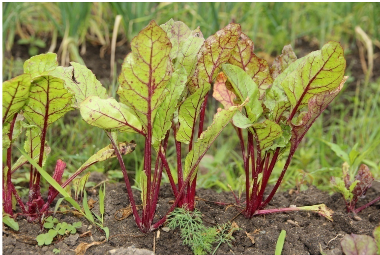
Рисунок 5 Ботва свеклы поверх грядки.

Они хотят по-са-дить цве-ты. Мама ска-за-ла: " Цве-ты са-жа-ют в саду".