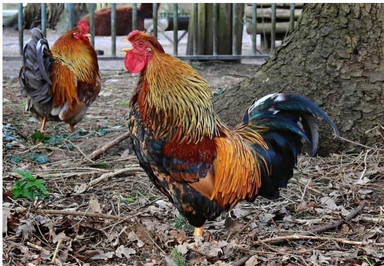
Рисунок 13 Петухи затевают драку

Чем похожи эти истории? Чем отличается то, как они рассказаны? Они различаются жанром. Рассказ и стихотворение. Прочитай выделенные слова в стихотворении. Слова похожи по звучанию. Это рифма.