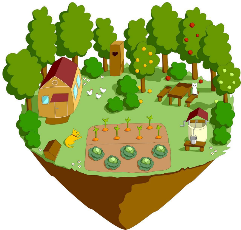
Рисунок 11 Иллюстрация садового участка земли с деревьями грядками постройками