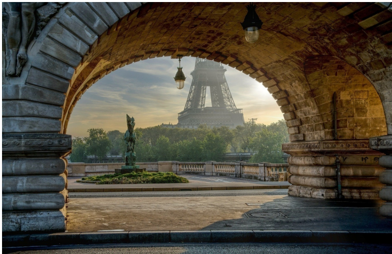
Рисунок 2 Арка