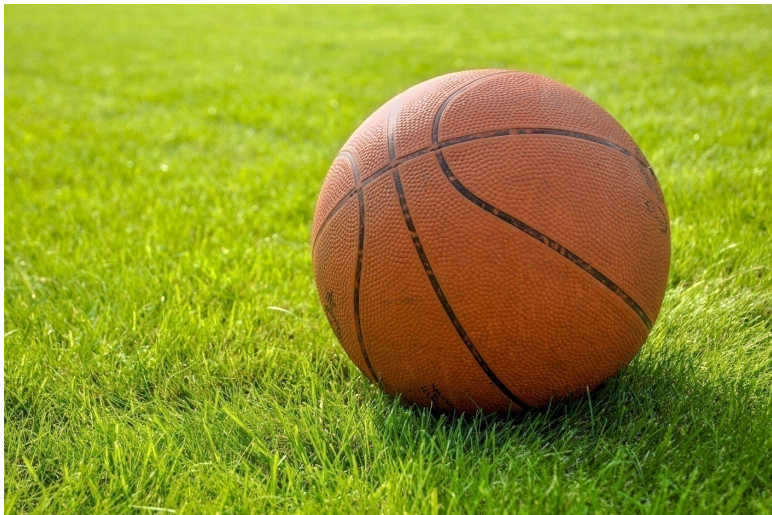
Рисунок 7 Баскетбольный мяч

Дай ответ на вопрос полным предложением: