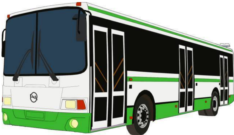
Рисунок 1 Пассажирский автобус