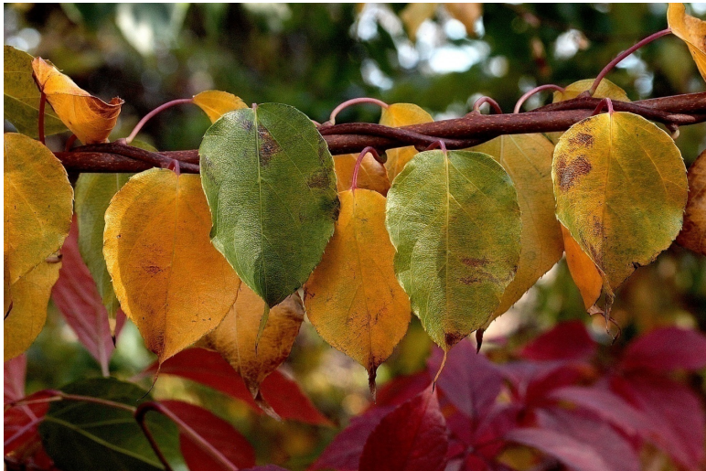
Рисунок 8 Осенние листья меняют цвет

С какой буквы начинаются слова каждой строки? В каких словах встречается буква О в стихотворении? О – гласный звук. Назови другие гласные звуки.