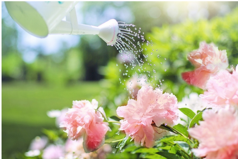
Рисунок 6 Полив пионов

Ма-лень-ка-я Юля вы-ко-па-ла ямку и по-ло-жи-ла в неё мячик. Юля сказала: " Я буду поливать мячик. Он вырастет большой".