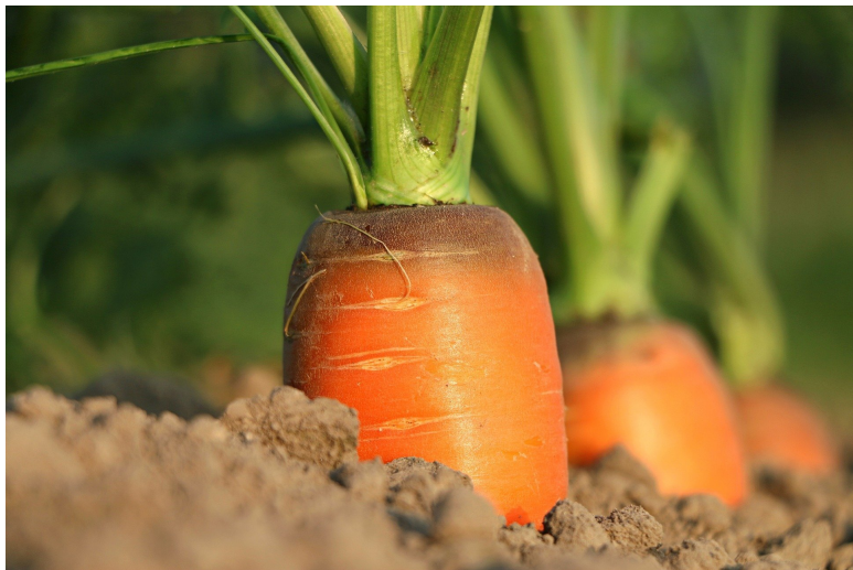
Рисунок 4 Морковь в земле

А-лё-ша, Ми-ла и Ю-ля жи-вут в де-рев-не. Там у них о-го-род и сад. На-сту-пи-ла вес-на. Мама и папа ра-бо-та-ют на ого-роде. Они сажают овощи: кар-то-фель, ка-пус-ту, мор-ковь, свёк-лу, по-ми-до-ры и о-гур-цы.