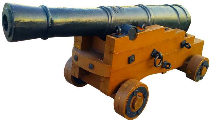
Рисунок 10 Старинная пушка "лафет"