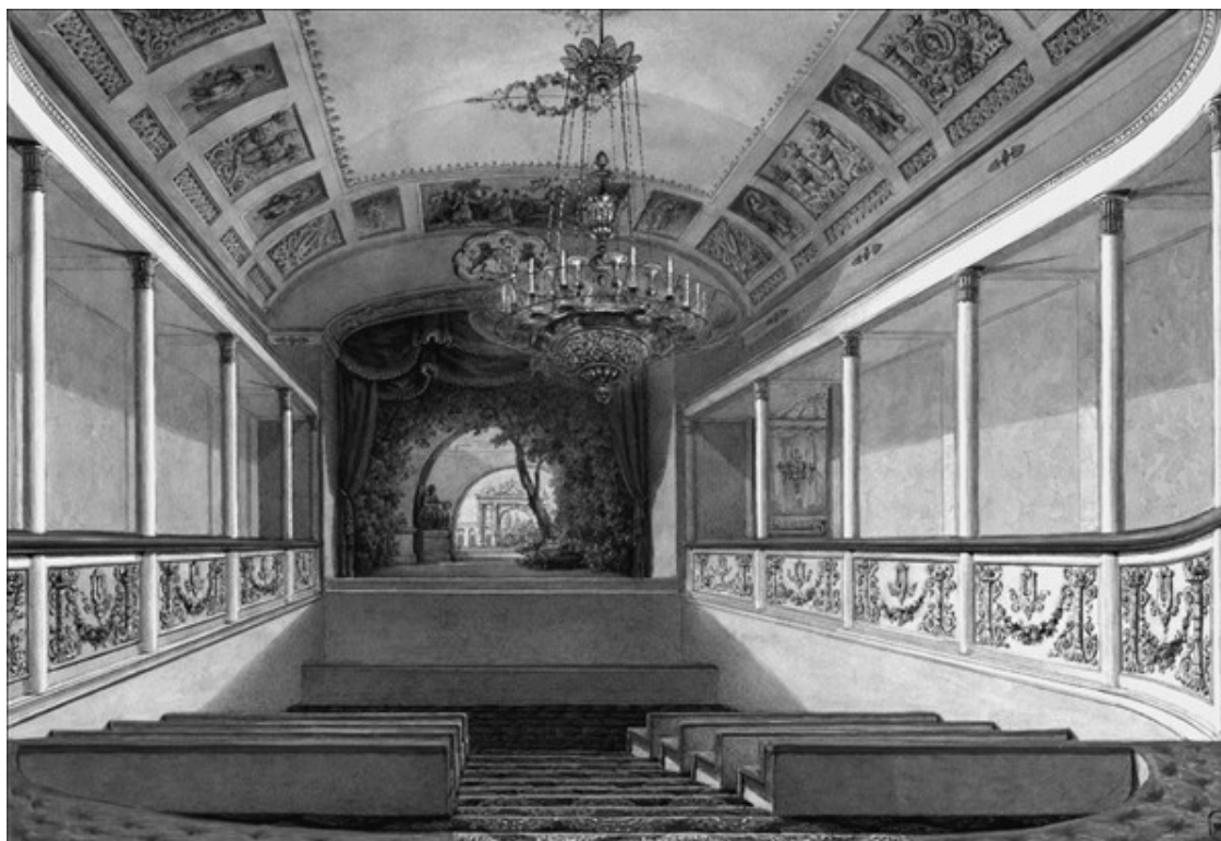
Интерьер домашнего театра. Художник В.С. Садовников

Кроме признанных мастеров театрального дела, спектакли сплошь и рядом ставили любители. Среди самодеятельных актеров, занятых в постановках, бывали члены одной или нескольких семей, соседи и близкие друзья. В домашних спектаклях богатых помещиков актерами часто становились крестьяне и дворовые люди. К премьере домашнего спектакля готовились неделями: выбирали пьесы и распределяли роли, репетировали, создавали декорации, шили костюмы и продумывали грим.