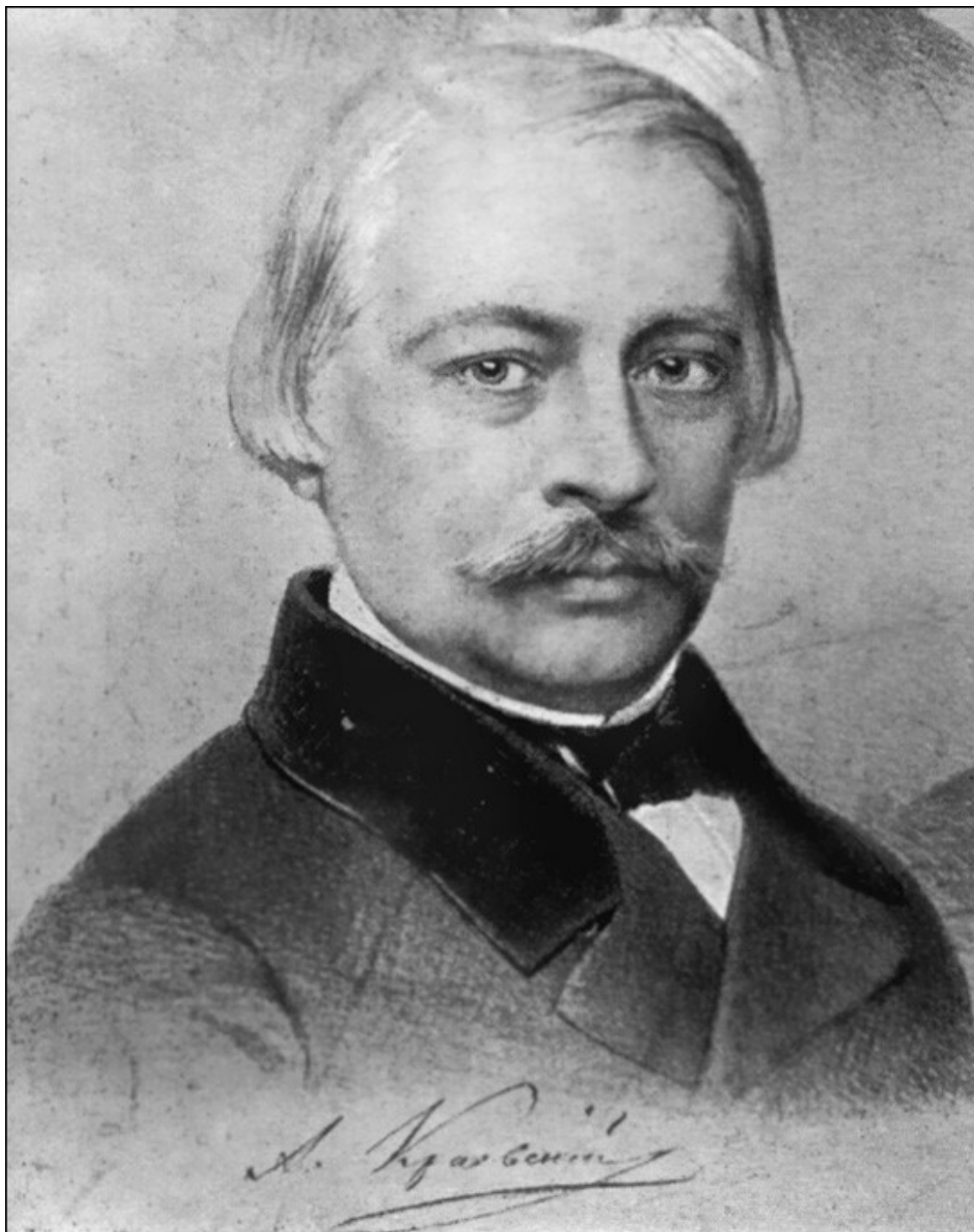
А.А. Краевский. Художник В.Ф. Тимм

Впоследствии Ипполит Панаев рассказывал: «Старшая дочь Брянского, очень красивая собою, готовилась начать сценическое поприще. Брянский очень обрадовался предоставить ей в ее дебют роль Дездемоны. В этой роли она произвела большое впечатление прекрасной высокой фигурой и красотой лица, особенно огненных черных глаз».