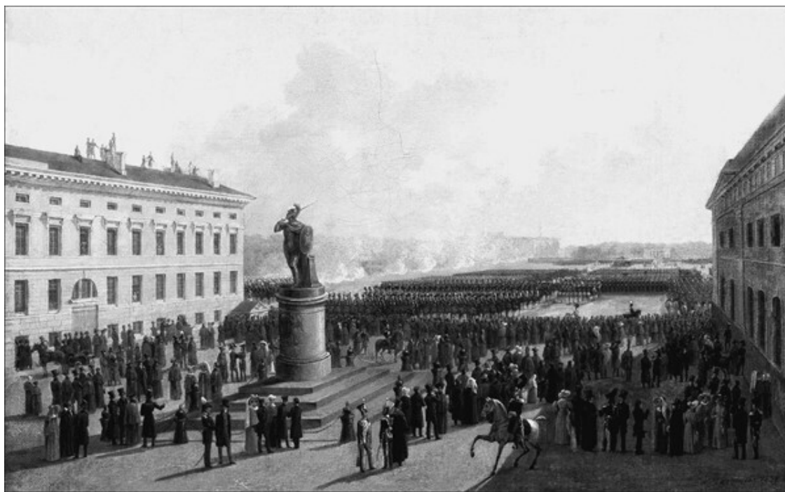
Петербург. Парад по случаю окончания военных действий в Царстве Польском 6 октября 1831 г. Художник Г.Г. Чернецов

Чернецов лично составил реестр с «объяснением фигур» (роспись поименно и с номерами), а к некоторым, например, к Пушкину, были добавлены краткие биографические сведения. Реестр был заложен в нишу за откидывающейся нижней планкой рамы.