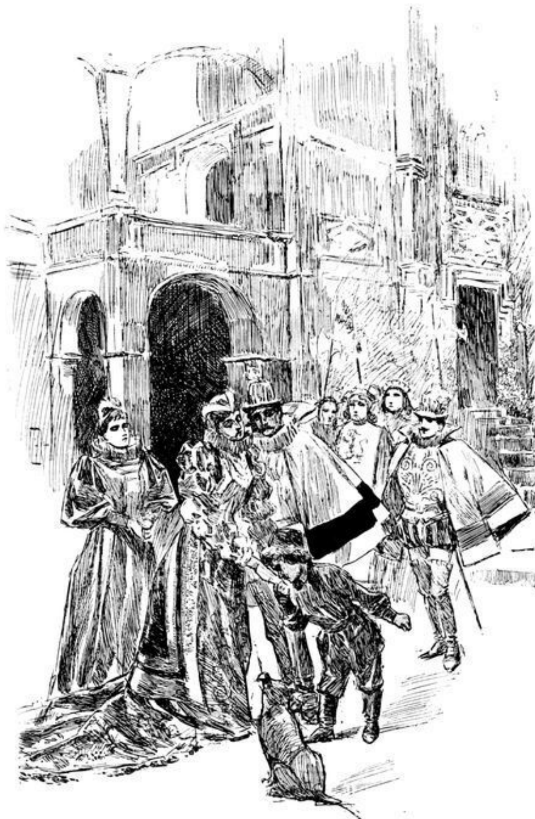
Прощание с замком фон Трампов