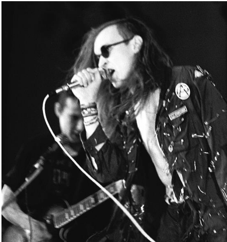
Москва, 4 декабря 1988 года, выступление «Гражданской Обороны» на фестивале «СыРок» в киноконцертном зале го- стиничного комплекса «Измайлово».