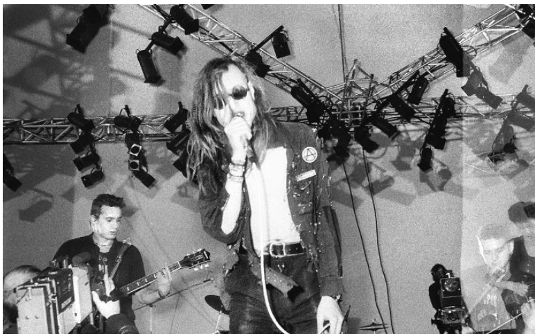
Москва, 4 декабря 1988 года, выступление «Гражданской Обороны» на фестивале «СыРок» в киноконцертном зале гостиничного комплекса «Измайлово», фото Юрий Чашкин.