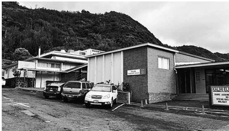
Начальная школа Калихи.

В 14 лет я перешел в седьмой класс в Иолани. Это была частная подготовительная епископальная школа, в которой обучали с детского сада и до конца 12-го класса. В мое время в школу принимали только мальчиков, и в выпускном классе было 150 учеников.