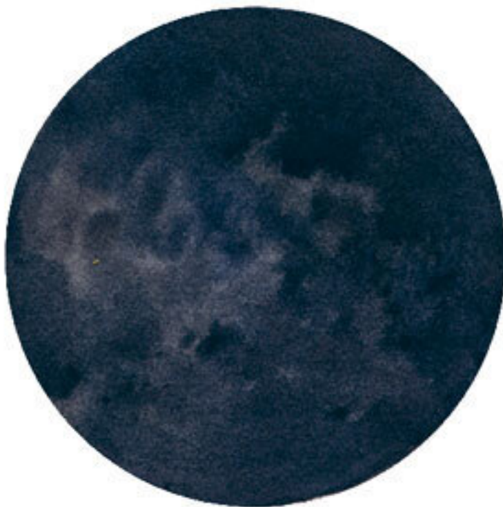
ФАЗА 1 НОВОЛУНИЕ Начало цикла – очищение.