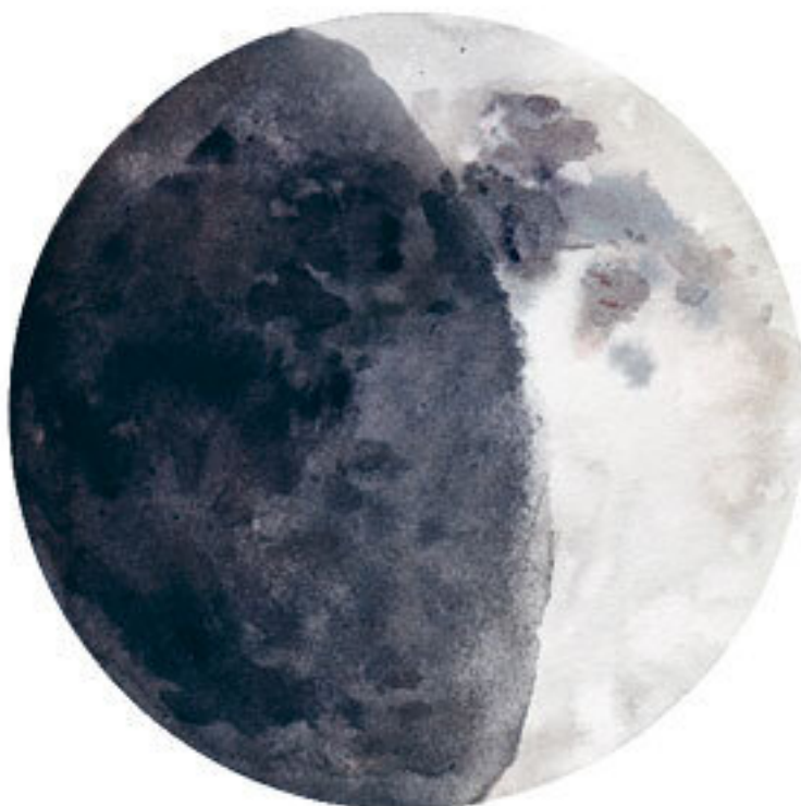
ФАЗА 2 МОЛОДАЯ ЛУНА