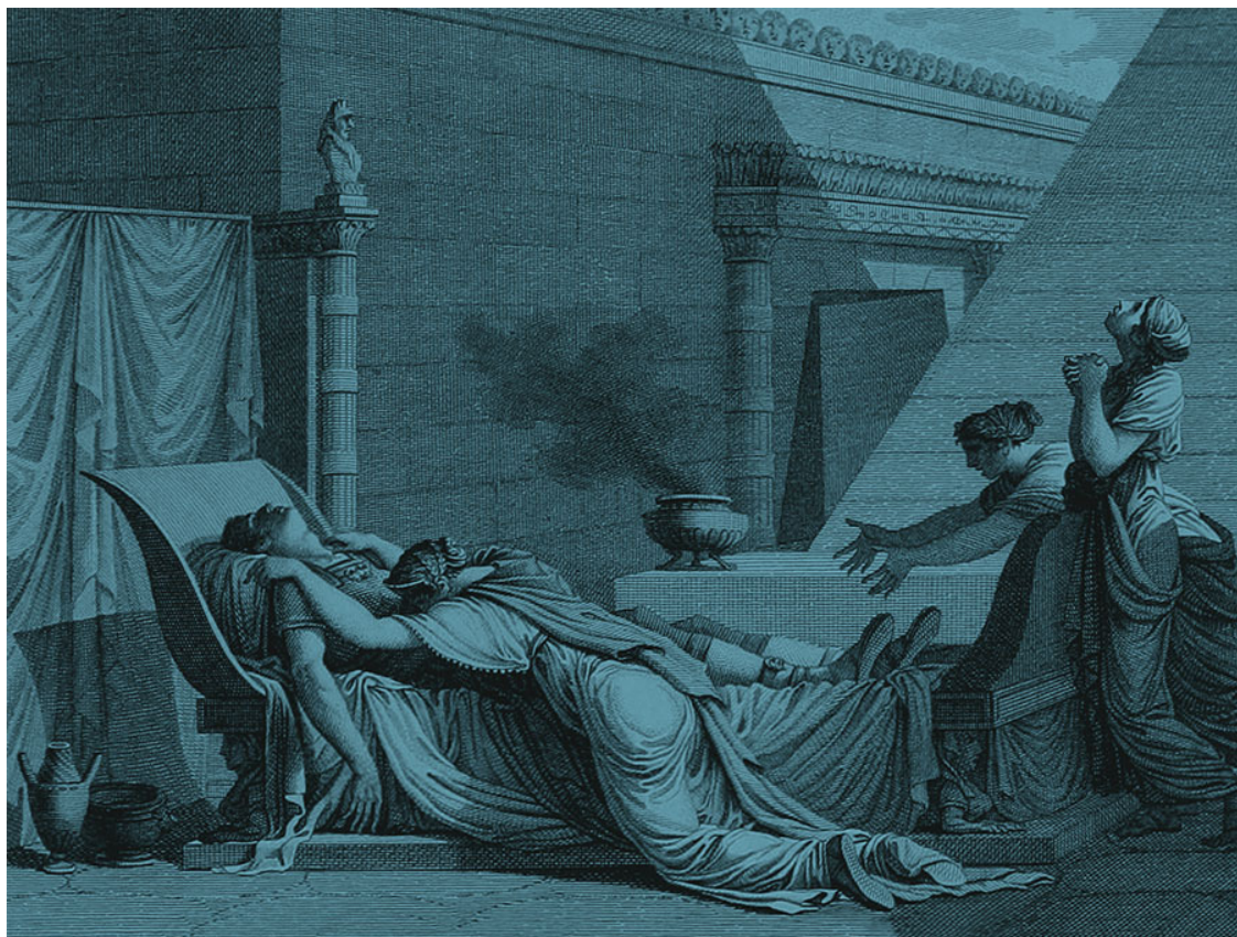
Непотляемому Этони Читаму с любовью и огромным уважением