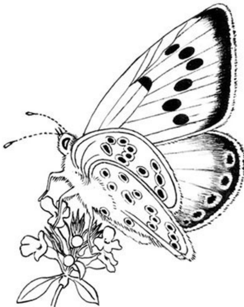
Голубянка орион (Phengaris arion (лат.))