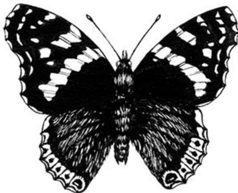
Дневная бабочка-адмирал (Vanessa atalanta, лат.)