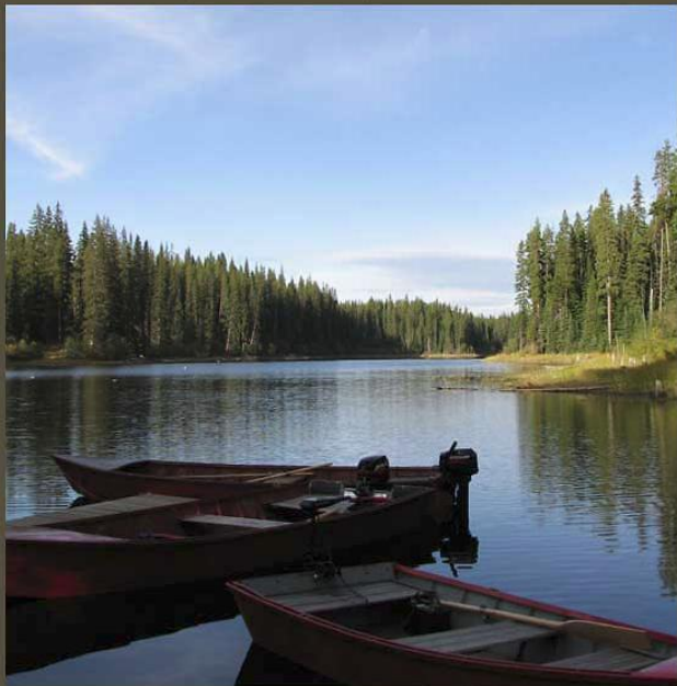
Лодки на реке

дилось, всё управление этой лодкой и её мотором осуществлялось при помощи обычного румпеля. Однако даже при таком «патриархальном» оснащении ни управлять «Пеликаном», ни обращаться с его мотором я не умел.