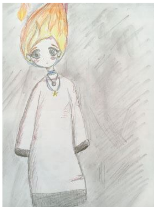
Рис. 1.7–1.8. Надежда. Темы заданий: «Дерево-маяк» и «Девочка-свеча»

Комментарии психолога. Скромная, любознательная, молчаливая и очень начитанная девушка. Правильная речь, сдержанна в проявлении эмоций.