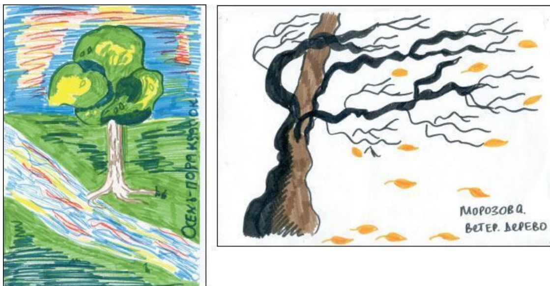
Рис. 1.1–1.2. Тема задания: «Дерево»

Иначе говоря, внешний стимул пробуждает к активности те структурные элементы памяти и воображения, которые отвечают за переживание чувств, связанных с ранее актуальными для личности лицами и событиями. По мере проявления из памяти значимых образов на смену одним могут выступить другие, семантически связанные с факторами текущего переживания. В гештальтпсихологии этот процесс обозначается как «смена фигуры и фона»: с завершением аффективного отношения к проявленному актуальному образу его статус изменяется – ранее значимая фигура оттесняется на уровень фона.