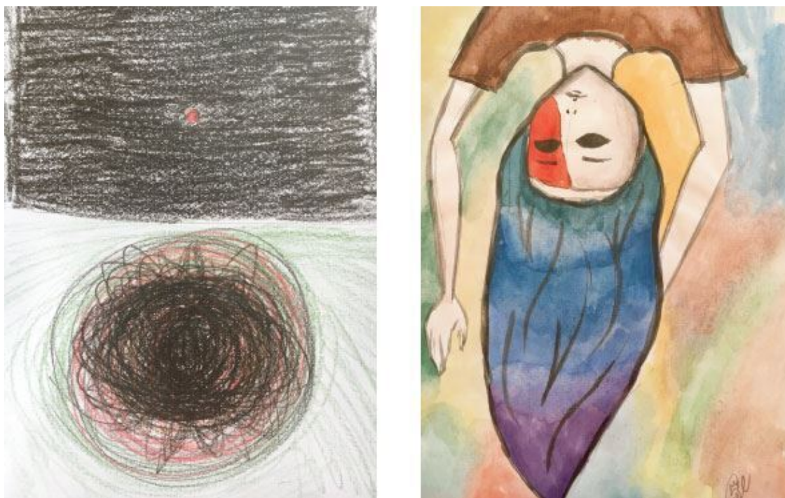
Рис. 1.5–1.6. Полина. Темы заданий: «Мой страх»; «Образ себя: Молчун»

2. Индукторы в известной мере специфичны в отношении характера извлекаемой генетической информации, но они неспецифичны относительно вида особи или ткани. В нашем случае, влияние арт-стимула на человека, прежде всего, носит симультанный, неспецифический характер. Однако в процессе арт-работы в актуальное поле восприятия и творческого выражения могут включаться и специфические индивидуальные проявления субъекта.