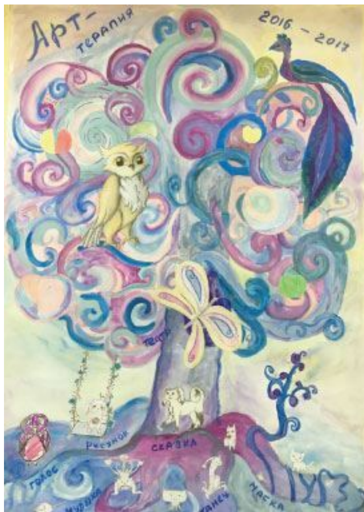
Рис. 1.16. Совместная работа подростков. Тема задания: «Древо познаний»