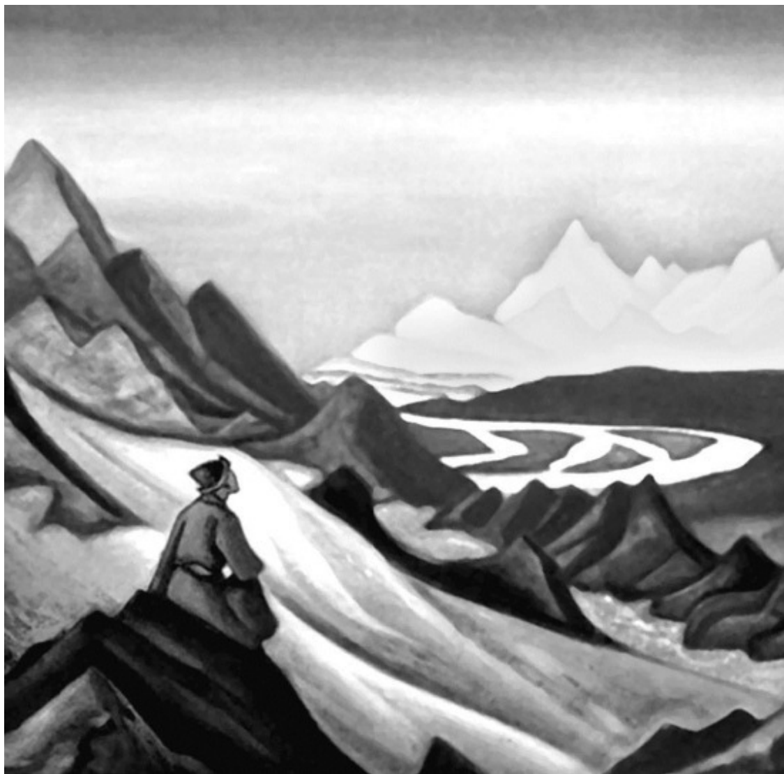
Н.К. Рерих. «Песнь о Шамбале. Тангла». 1943 г.

Лама улыбнулся. «О, это великие ортодоксальные монастыри. В Сера среди трех тысяч лам можно встретить много настоящих воинов. Многие ламы из других стран, например, из Монголии, живут в Гандане. Там находится трон нашего великого Учителя Цзонка-ба. Никто не может коснуться этого великого сиденья, не задрожав. В Депанге также есть несколько ученых лам».