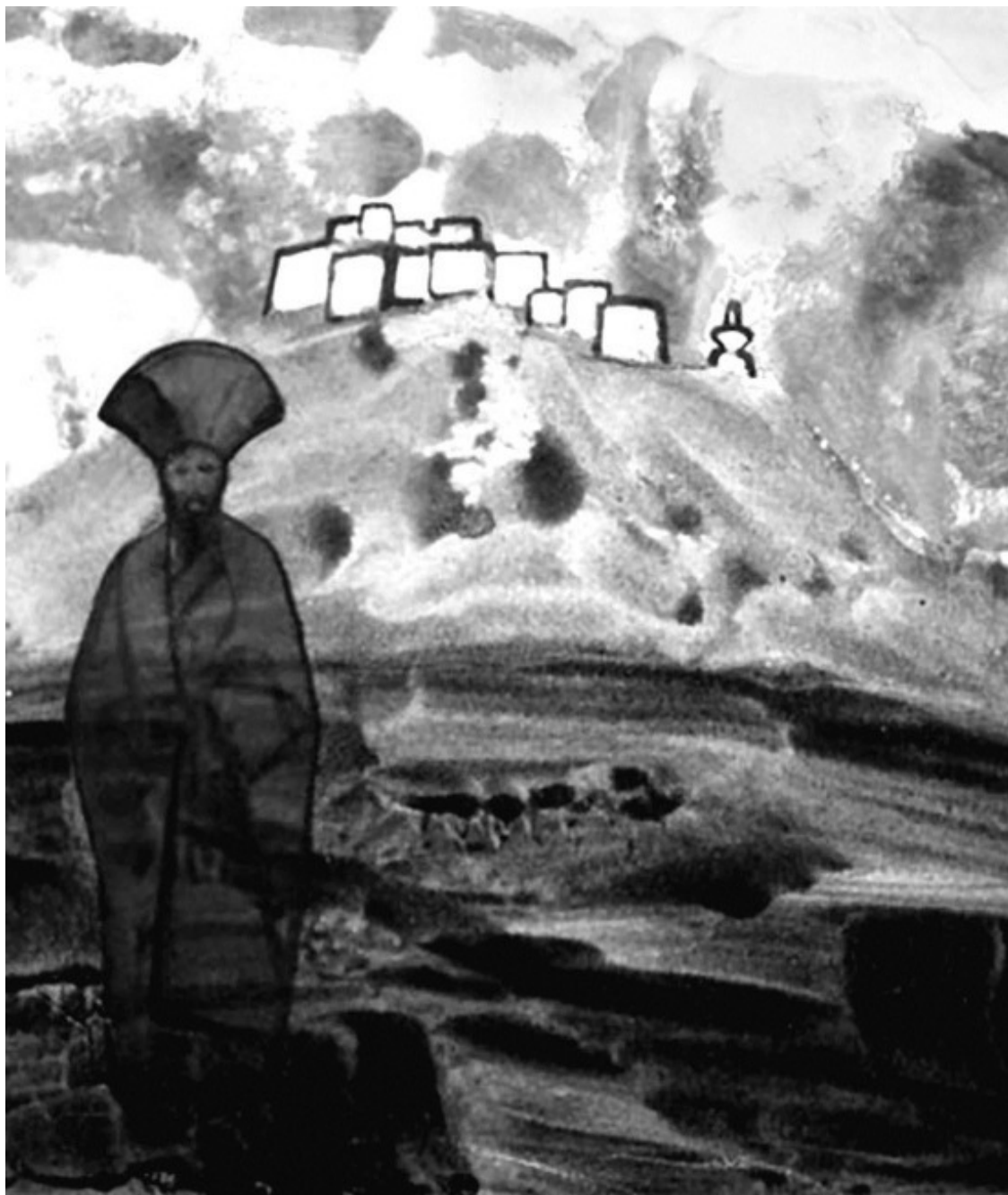
Н.К. Рерих. Красный лама. 1925–1930 гг. Картон, темпера, акварель.

«Ты прав. Не только колдовство, но также неуместное использование сверхъестественных сил запрещалось нашими великими Учителями. Но если дух настолько продвинут, что может делать многое и использовать любую из своих энергий естественным образом и в целях Общего Блага, – в этом случае, это не есть колдовство, но великое достижение, великий труд для человечества».