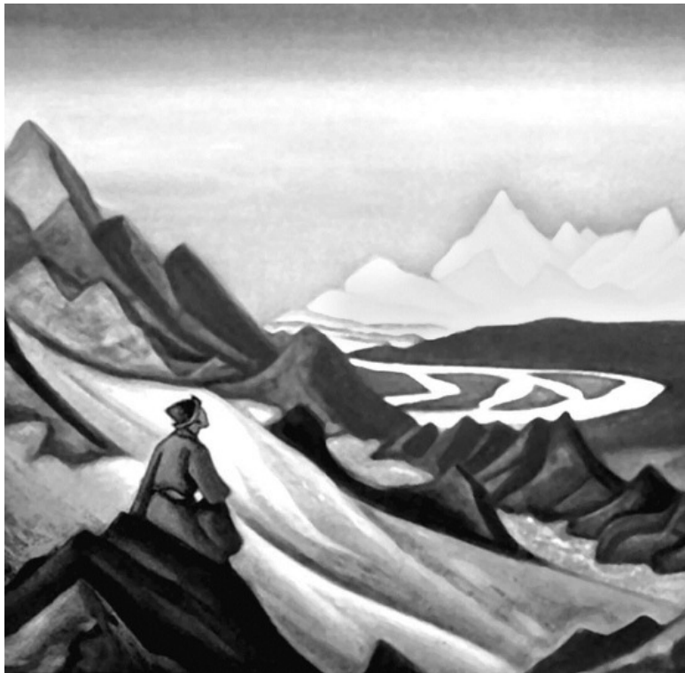
Н.К. Рерих. «Песнь о Шамбале. Тангла». 1943 г.

Лама улыбнулся. «О, это великие ортодоксальные монастыри. В Сера среди трех тысяч лам можно встретить много настоящих воинов. Многие ламы из других стран, например, из Монголии, живут в Гандане. Там находится трон нашего великого Учителя Цзонка-ба. Никто не может коснуться