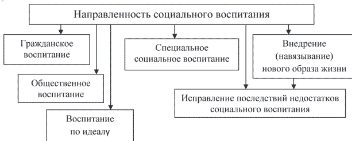
Схема 1. Основные направления социального воспитания с позиции государства (общества)

Гражданское воспитание характерно для любого общества и осуществляется под влиянием и контролем государства. Оно ориентируется на потребности последнего в воспитании подрастающего поколения как граждан, в подготовке их к самостоятельной жизни, ориентированными интересами и заботами своей страны. В рамках гражданского воспитания государство обеспечивает формирование личности с развитым чувством патриотизма и активной позицией по его реализации.