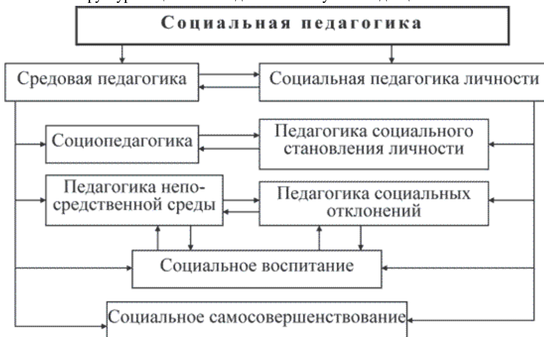
Схема 2. Структура социальной педагогики как учебной дисциплины