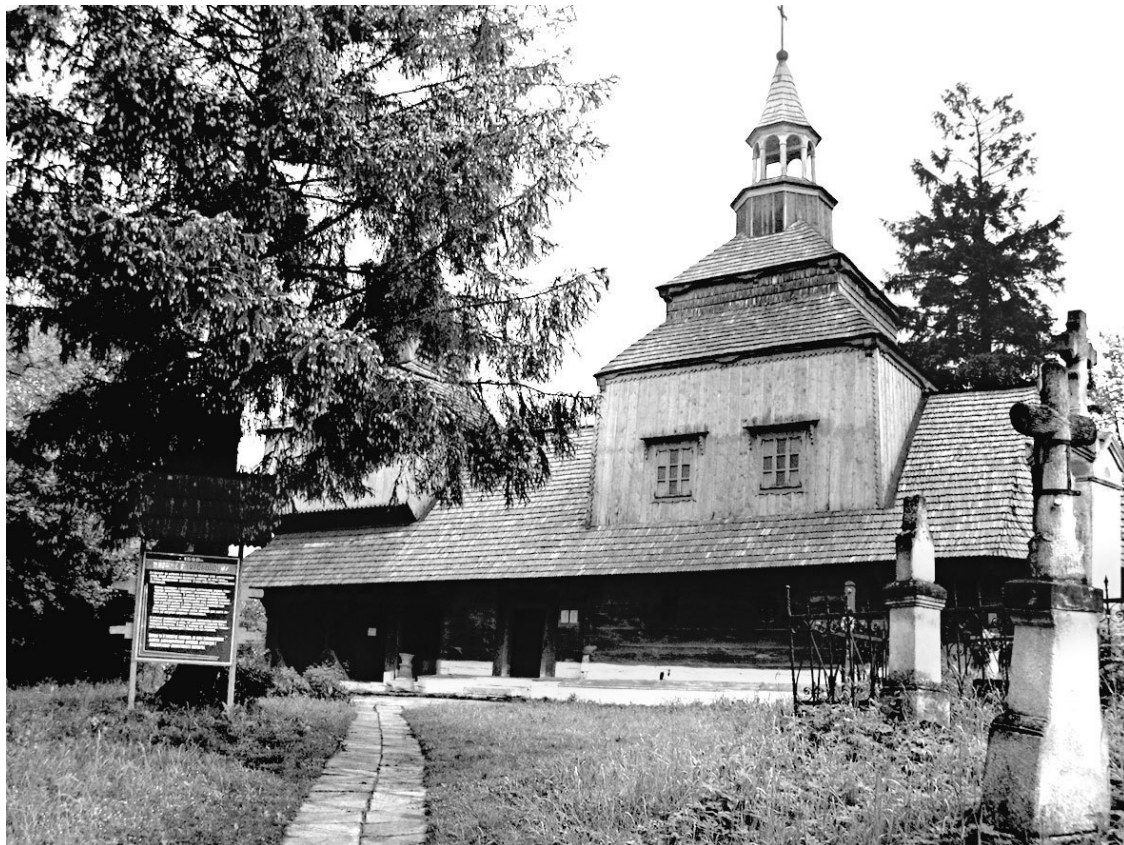
Церковь Святого Духа в Рогатине