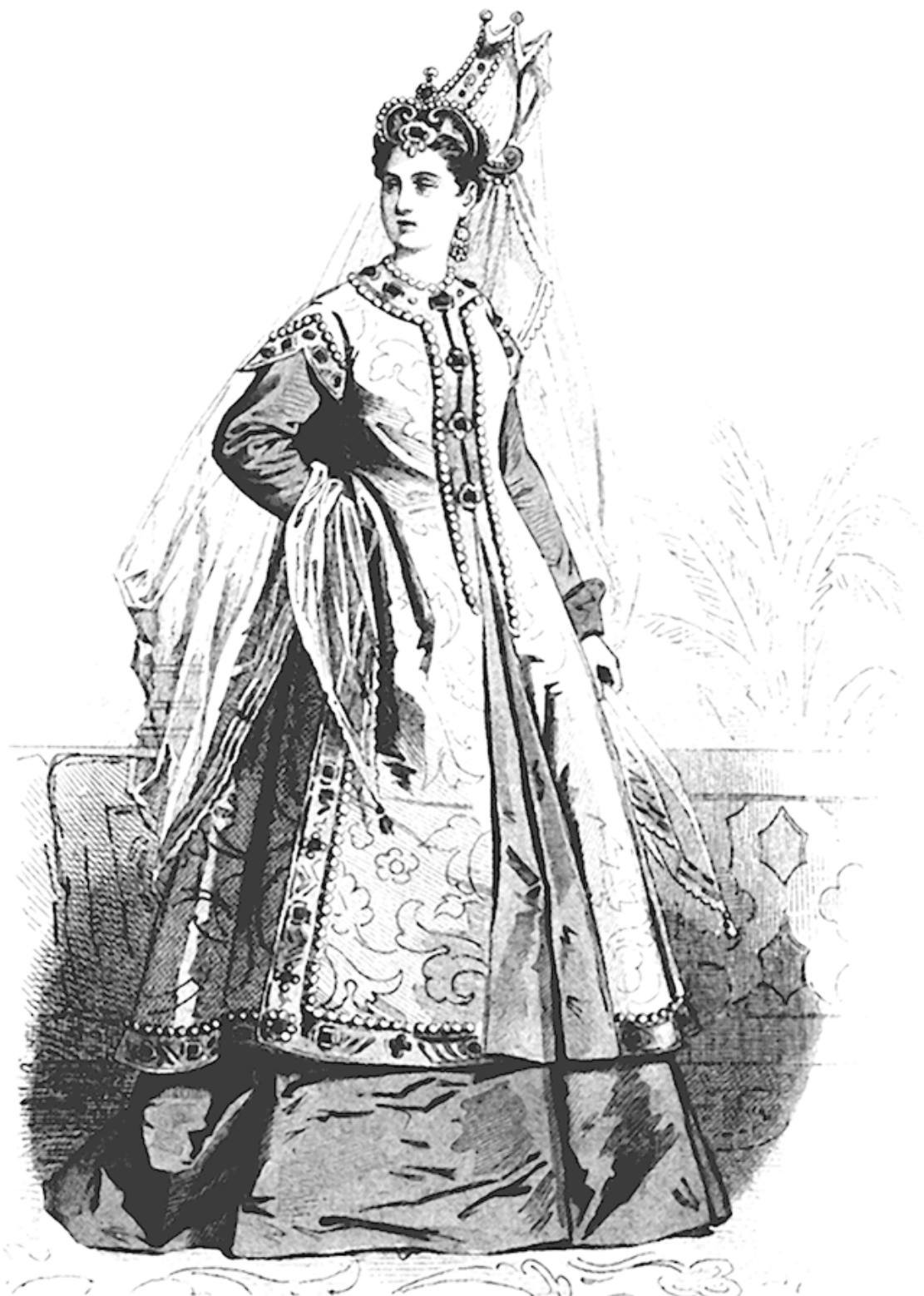
Роксолана одета в роскошное платье