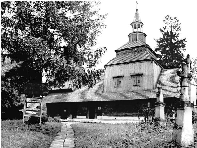
Церковь Святого Духа в Рогатине