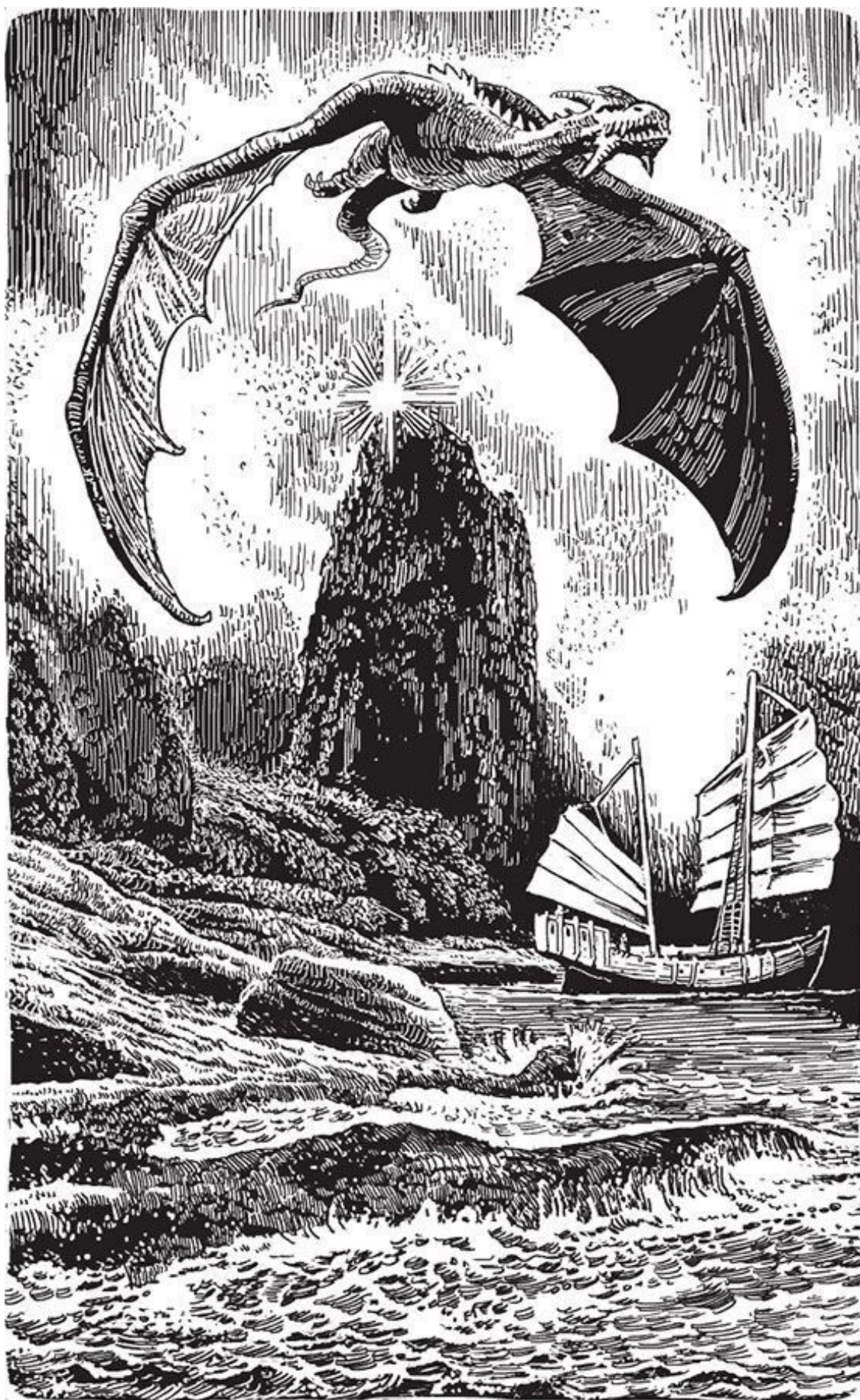
Ursula K. Le Guin