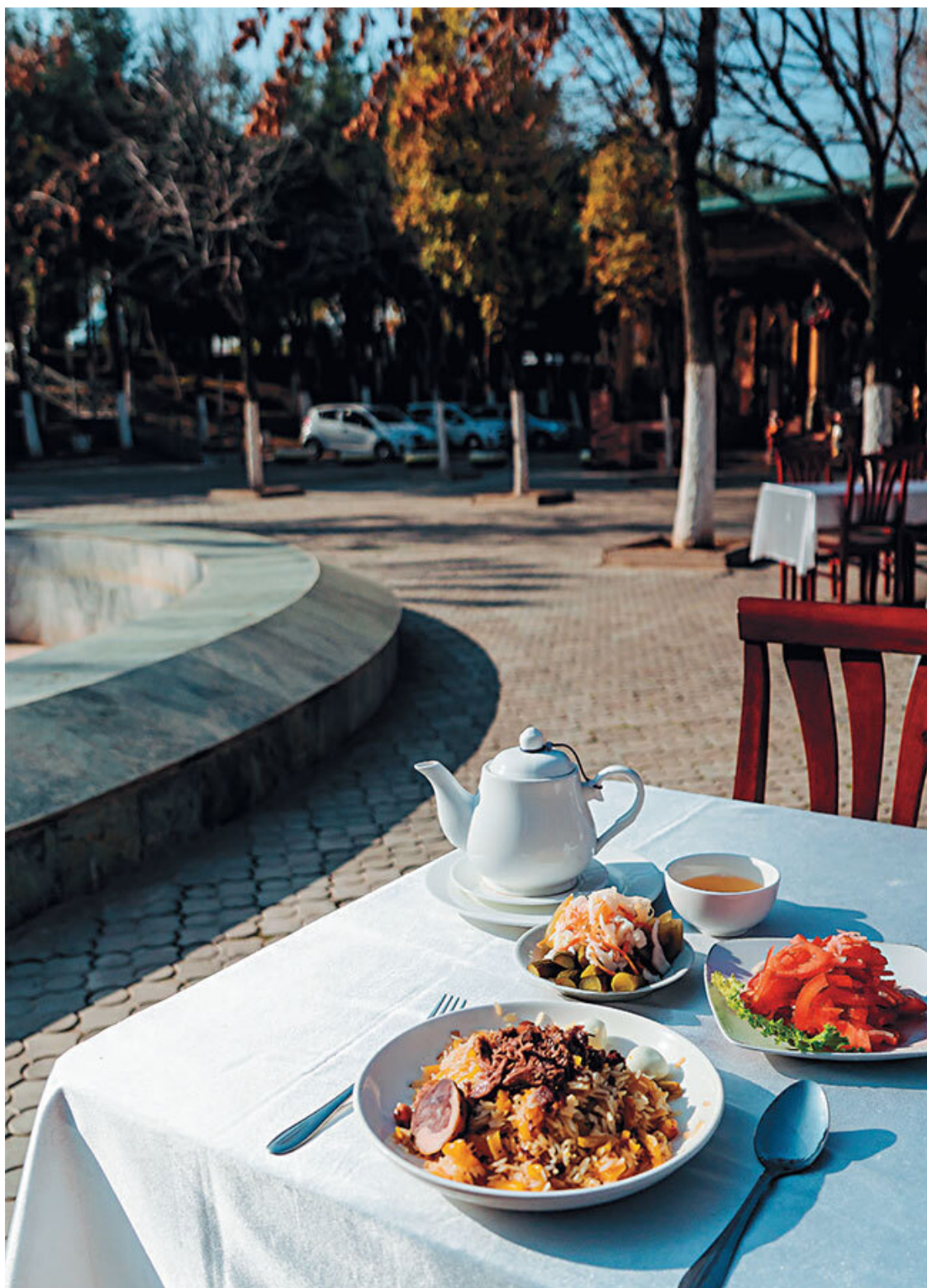
В ташкентской чайхане