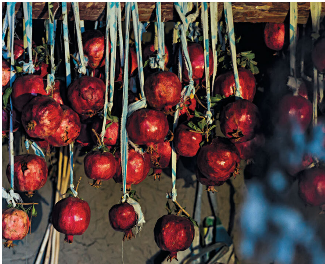
Хранение гранатов зимой

Кунжут , чаще всего черный, иногда украшает глянцевую поверхность самсы или лепешек. Кунжутное масло входит в состав некоторых рецептов плова.