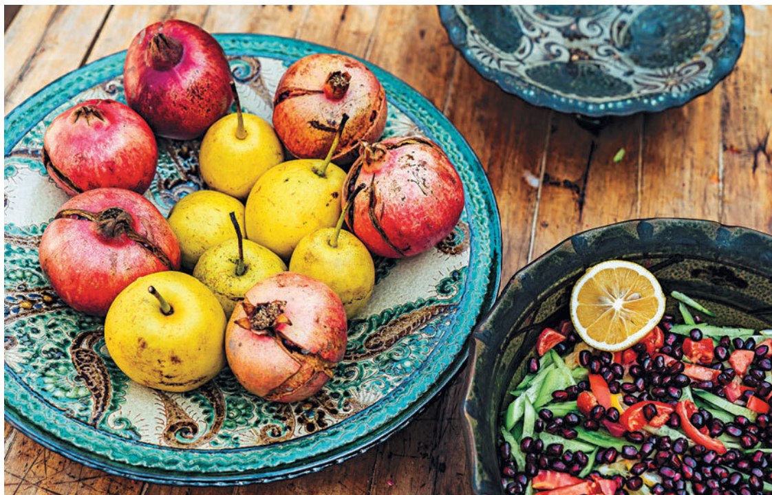
Ляган работы рижитанского мастера Алишера Назирова

Ляган – большое плоское круглое блюдо, предназначенное в первую очередь для подачи плова. Маленький ляган – ляганчик , но он все равно существенно больше любой тарелки, даже самой большой, которую вы можете себе вообразить. Поэтому, если вам предлагают ляганчик плова , рассчитывайте на ханский пир.