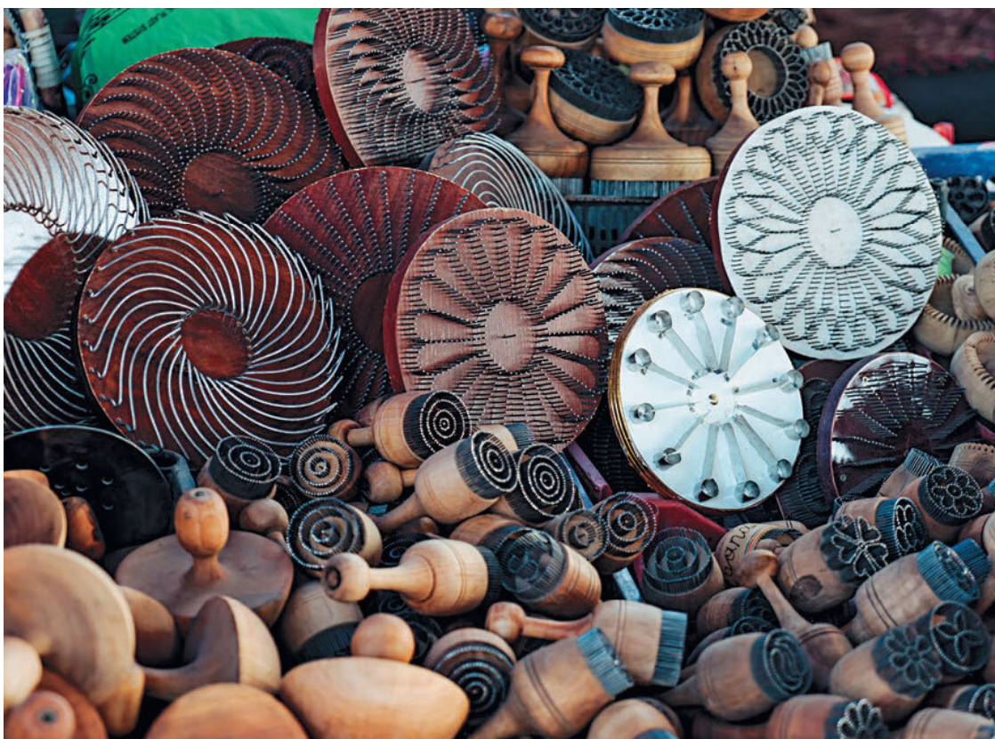
Штампы для лепешек

Пресные лепешки – дрожжевые, глянцевые, с посыпкой в центре, правильной круглой формы, с углублением в середине. В такие лепешки идет только вода, мука, дрожжи и немного соли. В разных регионах такие лепешки получаются разной формы и толщины – в Ташкенте они будут более легкими и пористыми, в Самарканде – тяжелыми и плотными. Глянцевой поверхности добиваются, смачивая лепешки водой. Самаркандские лепешки перед продажей протирают растительным маслом. Часто углубление в центре посыпают седаной или кунжутом.