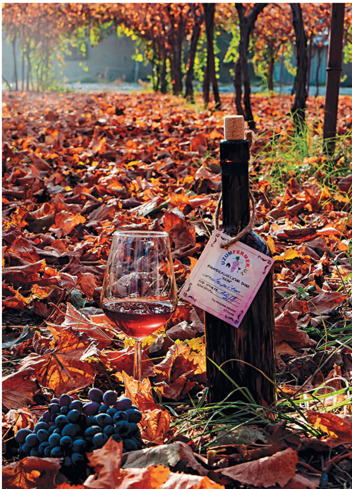
В хозяйстве Uzum Fermer

Одна из главных особенностей узбекского винного рынка – хаотичный брендинг и фантастических объемов продуктовые линейки практически у каждого производителя. Почти каждый завод делает десятки наименований вин, стараясь занять несколько ценовых ниш сразу. К этим десяткам наименований прилагаются десятки стилей оформления этикеток, сделанных настолько причудливо, что, стоя у полки, вы с трудом сможете догадаться, что вина перед вами были произведены, скажем, одним и тем же предприятием. В более глобальном смысле это