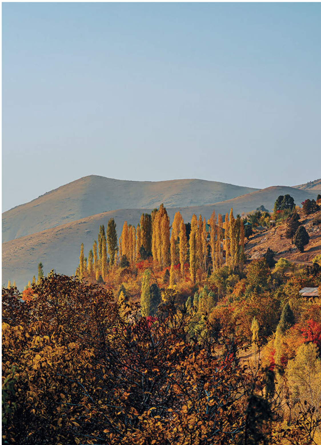
В горах Ангрена