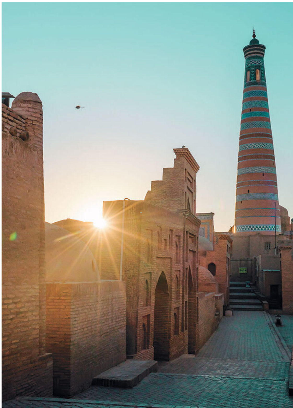
Хива, старый город

Не претендуя на развернутый исторический очерк, хочу рассказать об истории Узбекистана через призму религии, самых известных имен и понятий, а также влияния тех или