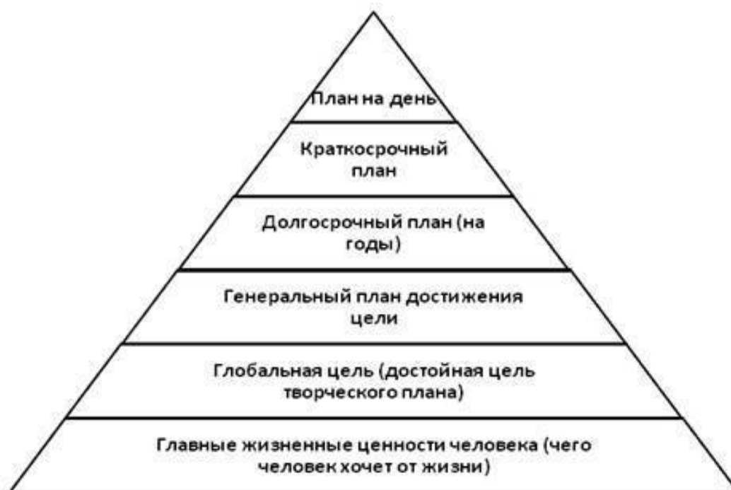
Рисунок 4. Ценности и цели

Ещё один важный момент, которые многие упускают, – это ценности и цели. Ценности и цели я показал в виде такой пирамиды: