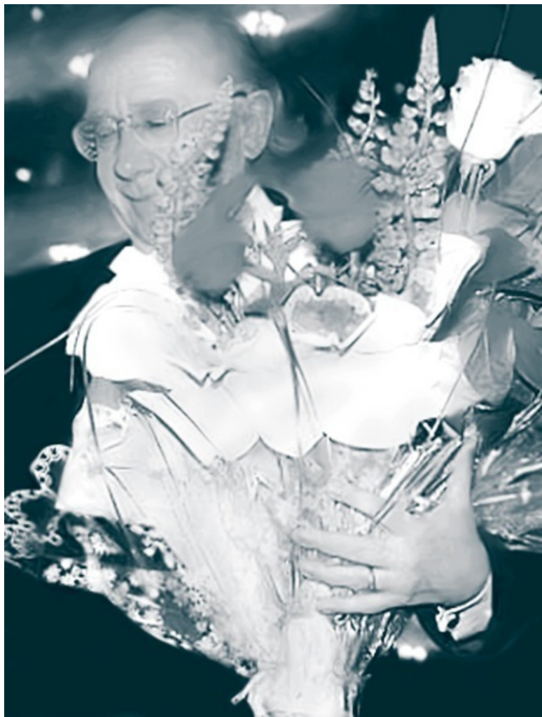
Выдающийся маэстро Геннадий Рождественский на посту