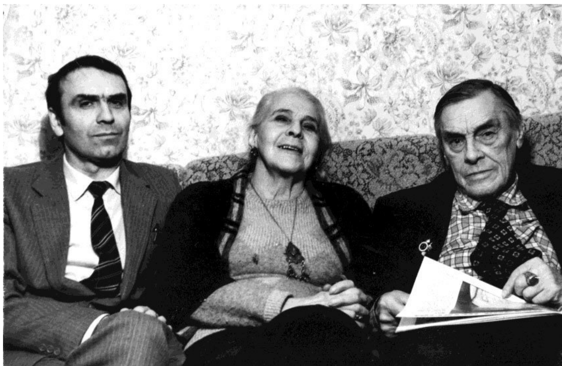
С Арсением Тарковским и его супругой