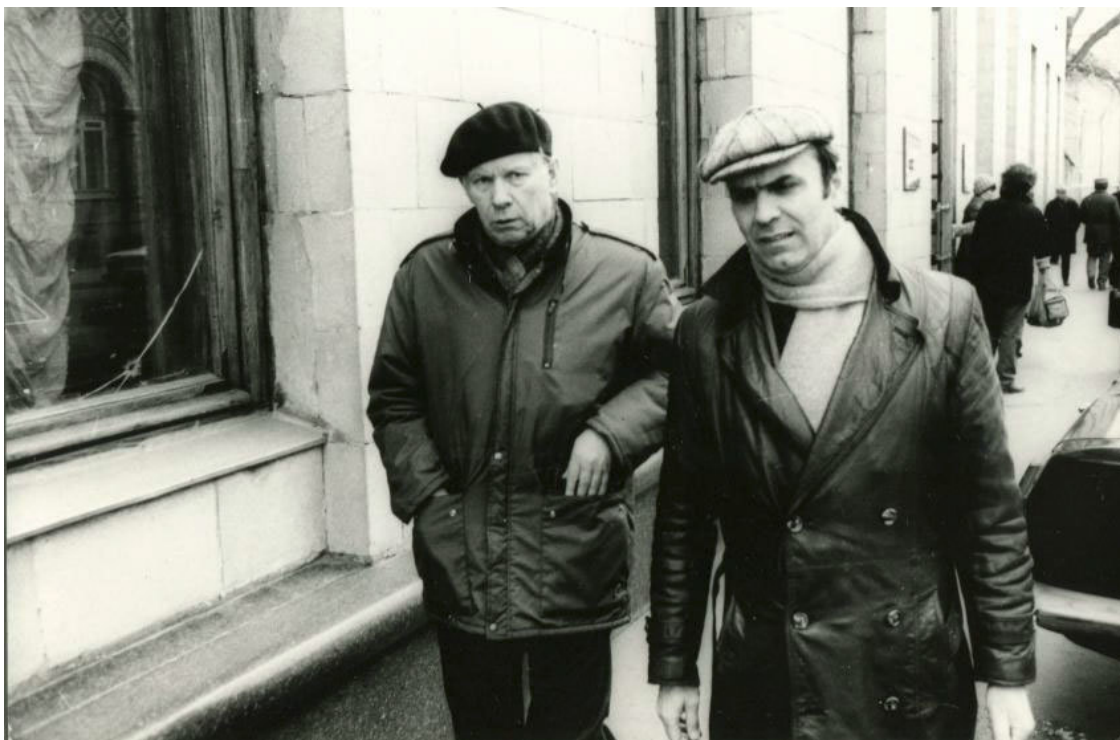
С Василем Быковым

Я сказал Быкову, что однажды выдающегося американского писателя Уильяма Сарояна спросили: может ли исчерпаться материал для творчества? Сароян ответил: нет, не может, ибо материал – это я сам. Пока я жив, мне будет достаточно материала для книг. Василь Владимирович прокомментировал этот разговор следующим образом: «Сароян, как известно, большой художник нашего времени, и в таком качестве он сказал сущую правду. Как всякий реалист, он черпает свой материал из окружающего мира, но не меньший мир заключен в нем самом, для его выражения не надобно ничего больше, кроме самого себя и своего дарования».