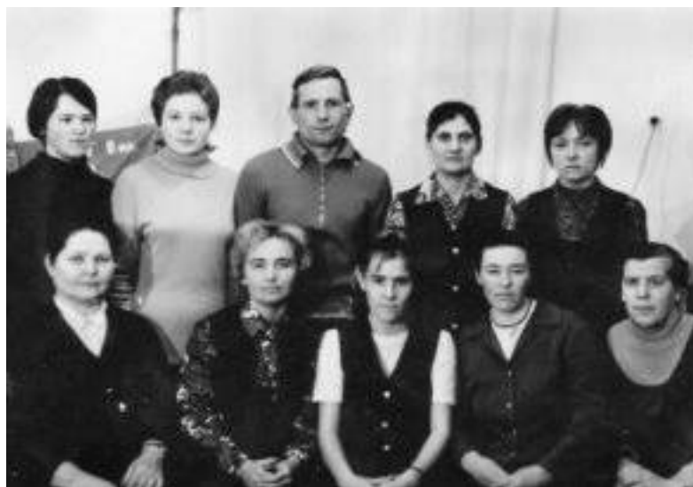
Учителя Драгунской восьмилетней школы