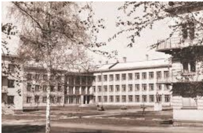
ученые из Академгородка.

Экзаменационная пора была насыщена также и всевозможными общественно-политическими мероприятиями. Среди них наиболее значимой была информация о вводе армией Варшавского договора Чехословакию. По этому вопросу выступали не только офицеры, но и