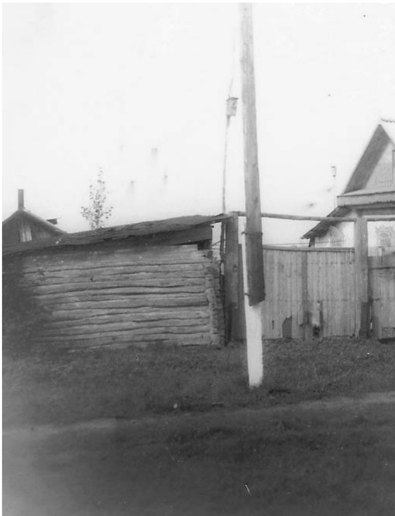
пропетровск: Полиграфист. – 2002. – с. 13).