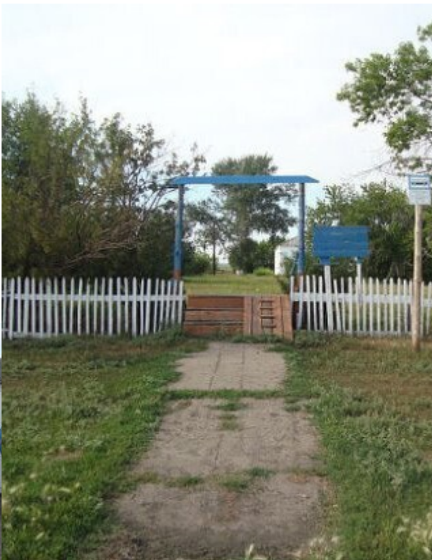
Драгунская восьмилетняя школа. 2014 год

Прошло полвека после того, как мы расстались и очутились в различных точках необъятной страны, имя которой Советский Союз. Порю мне кажется, что мы и до сих пор единый коллектив, живем одними интересами и заботами. И не только это. Мы имеем также теплые воспоминания друг об друге и о школе. Особенно о «демократическом» периоде, производственной практике. Весь девятый класс был направлен в лагерь труда и отдыха, который находился в трех километрах от центральной усадьбы совхоза «Черемновский». Предстояла работа по прополке свеклы, подсолнухов, капусты. Какого-либо контроля за практикантами не было. Был только один наставник, учитель труда. Свободное от работы время каждый из старшеклассников проводил по-своему. Одни ходили купаться в котлован, другие играли в бильярд в совхозном клубе или попросту болтались. Для меня же популярной была игра в футбол. Я с нескрываемой радостью встретил известие о том, что на стадионе в воскресенье состоится встреча между совхозной командой и командой лагеря труда и отдыха. Об этом даже информировала афиша, которую написал местный киномеханик и вывесил ее на доске объявлений. В первом тайме счет так и не был открыт. В перерыве к нам подошел начальник лагеря и полупуштя-полусерьезно сказал: «Ребята, если выиграете у старших, то получите ящик вафель». В итоге мы выиграли, оба гола в ворота противника забил я. Затем состоялся торжественный ужин. Начальник лагеря под аплодисменты присутствующих вручил капитану команды ящик