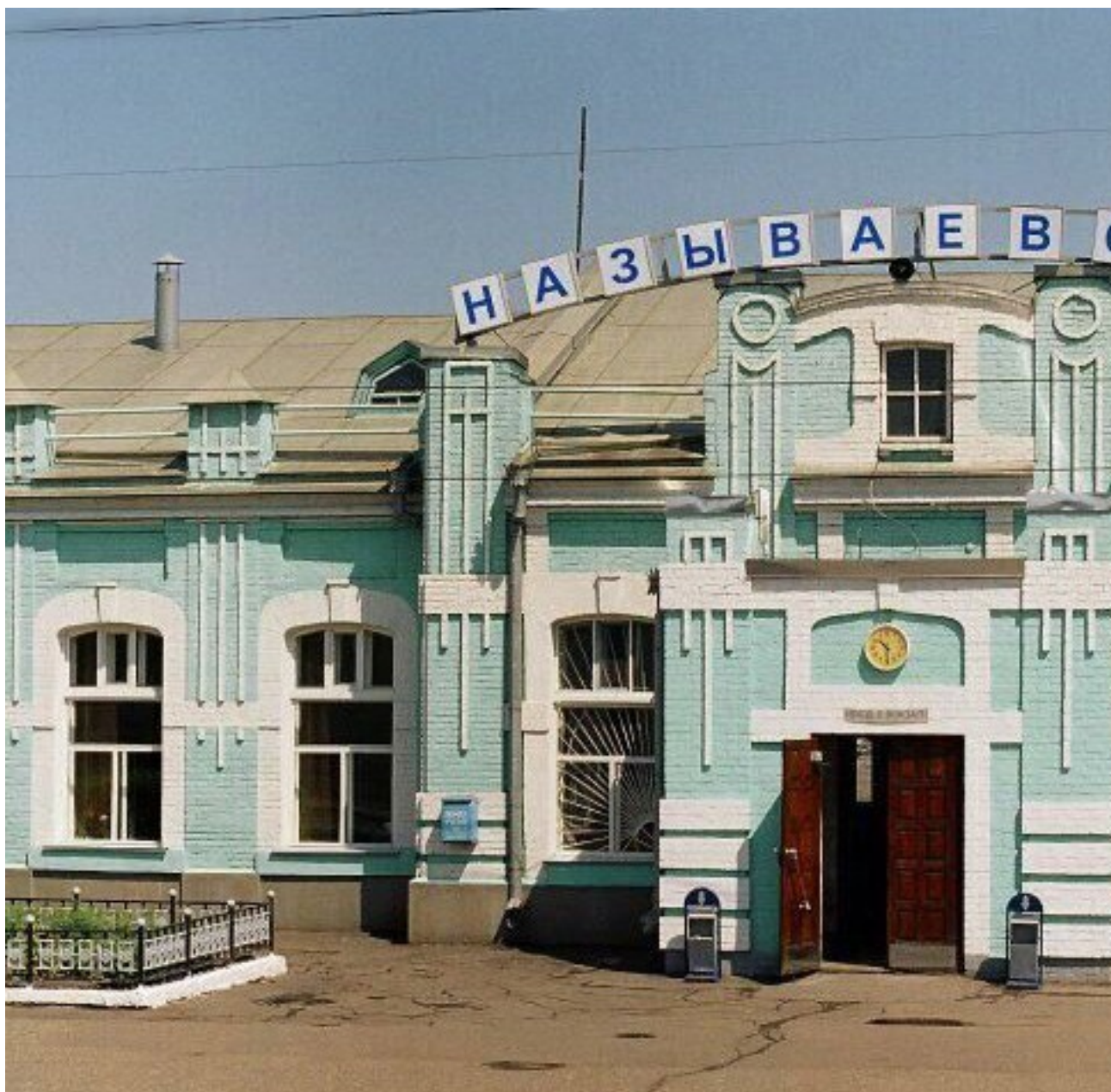
Железнодорожная станция «Называевская». 1975 год

Город Называевск, как и железнодорожная станция «Называевская», очень много значили для моей жизни. В годы моего детства и отрочества это было место, где «пахло» городом, были магазины, колхозный рынок, кинотеатр и даже милиция. При Доме быта было небольшое фотоателье, где я сделал фотографию на паспорт. Для фотографа моя физиономия оказалась фотогеничной. Несколько месяцев мое фото было на специальном стенде, на котором выставлялись лучшие работы пожилого мастера. В ателье этого же Дома быта мне сшили костюм черного цвета для выпускного вчера (1968 год).