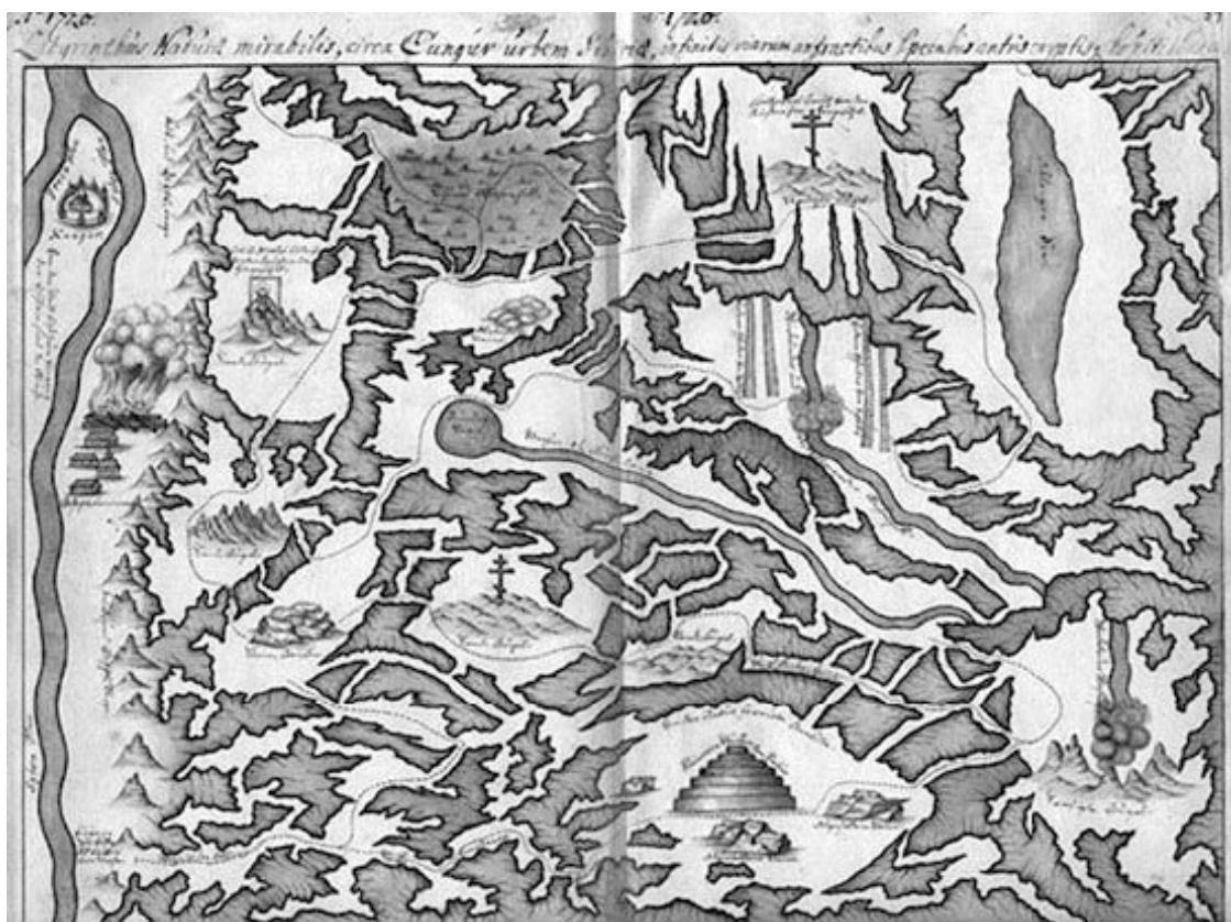
Карта из путевого дневника Мессеримидта.

Утром (в Чауском остроге) крестьянин предложил купить две могильные золотые серьги; но оне не понравились г. доктору. На сделанный крестьянину вопрос, нет ли у него других могильных вещей или изображений, последний ответил, что у него ничего такого более нет, но что в трех днях пути оттуда, на реке Оби, лежит деревня Орда; там живет крестьянин, у которого есть красивый идол из желтой меди. Мы спросили, не может ли он нам привести этого человека; но он полагал, что теперь его там, пожалуй, нет, так как он часто уходит на раскопку могильных вещей. После этого крестьянин ушел, но доктор опять послал за ним, чтобы узнать от него имя крестьянина, живущего в Орде; однакоже его уже не могли разыскать <...>