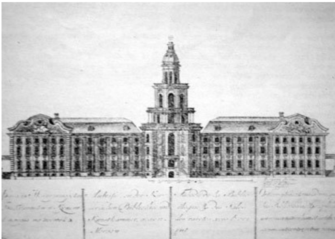
Вид библиотеки Академии наук

По указу вашего императорского величества, я, нижеименованный в 1721-м году месяца февраля от вашего величества лейб-медика господина Лаврентия Блументроста 26 во Францию, Немецкую землю, Голландию и Англию с последствующими комиссиями и инструкциями отправлен был, чтоб 27 :