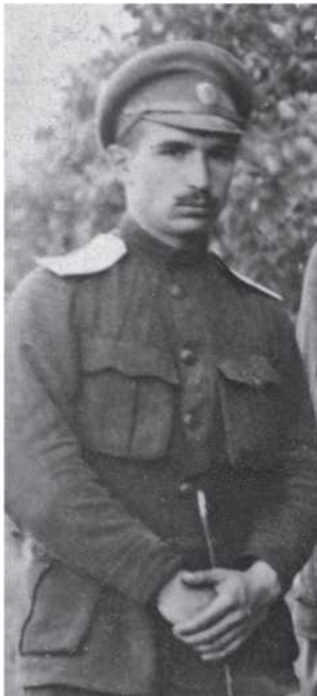
В. Н. Ефремов, фото 1916 г.