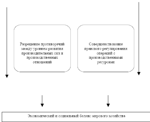
Рис. 2. Механизм регулирования мирового хозяйства средств производства является обязательным условием социально-экономического прогресса.

Механизм мирового хозяйства помогает решить центральную проблему современной экономики – определение и формирование потребности национальных экономик в средствах производства, предметов потребления и в услугах. Причем этот процесс является достаточно плавным и адаптивным к внешним воздействиям со стороны участников мирового хозяйства.