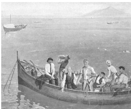
В. Ленин и А. Горький с рыбаками на о. Капри. Картина, художник Е. М. Чепцов

Эти слова Председателя правительства молодой Советской России Владимира Ульянова (Ленина) как нельзя лучше подходят к сегодняшнему положению в экономике страны и рыбной промышленности в частности. Приняв в 1985, 1992, 2001 годах руководство страной М. Горбачев, затем, соответственно, Б. Ельцин и последующие Президенты России навязали ей новые либеральные рыночные ценности, отвергнув прошлые положительные приемы рыбной отрасли. В результате страна с первого-второго места в мире по вылову и производству рыбной продукции скатилась к девятому, а потребление водных биоресурсов населением России уменьшилось в 2 раза: с 23–24 до 12–13 кг на человека в год. При этом часто можно слышать от руководителей экономико-финансового блока Правительства России, да и от руководителей рыбной отрасли, что либеральные рыночные отношения априори отвергают те «приемы», пусть и результативные, которые оправдали себя на практике в прошлом. Так ли это? И как на переломном, не менее сложном, чем сегодня, периоде в 1917–1924 годах при переходе от монархии и капитализма к советам и социализму поступали руководители того времени и в частности Владимир Ульянов (Ленин) в отношении рыбной промышленности, которая в то время была действительно кормилицей населения, армии и прочих госструктур.