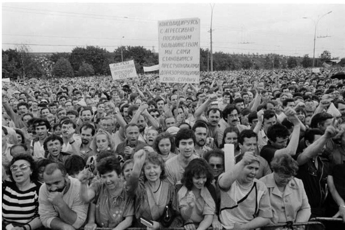
„Перемен требуют наши сердца!“ Митинг в Лужниках, лето 1989