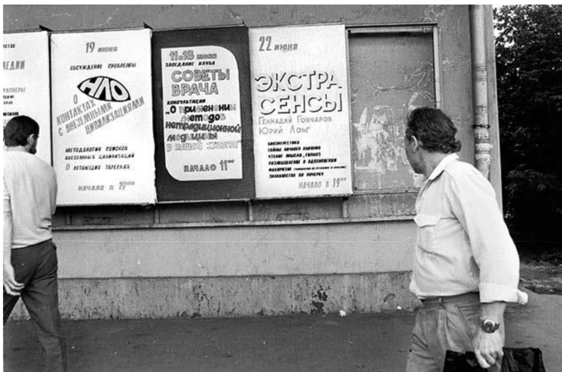
Афиши на стенде ДК Зуева на Лесной улице – Экстрасенсы и инопланетяне...