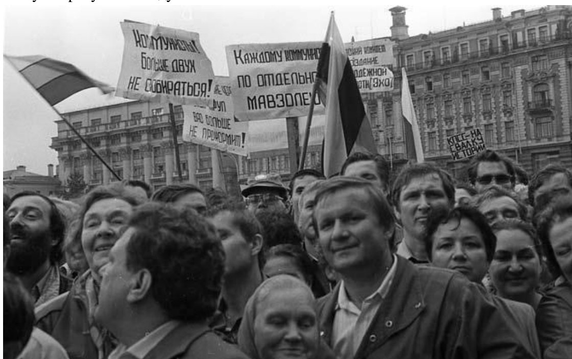
Митинг на площади 50-летия Октября (в 1990 году переименована в Манежную). КПСС – на свалку истории!