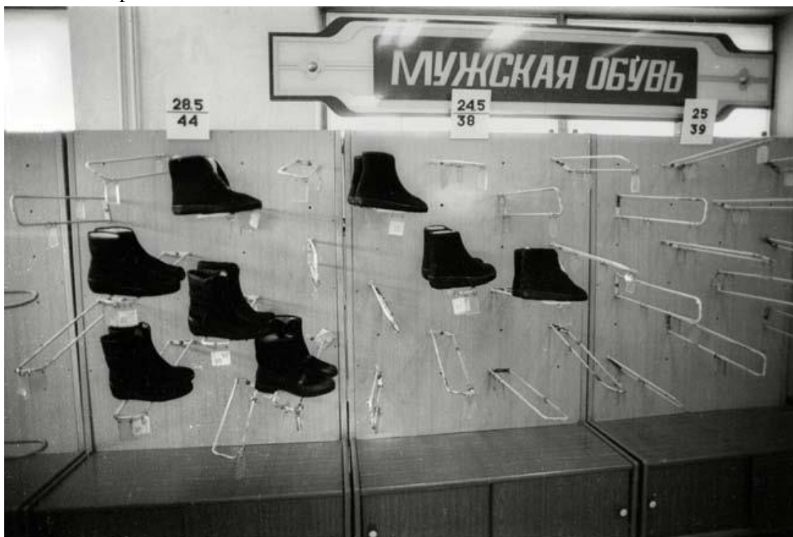
Отдел мужской обуви в советском магазине