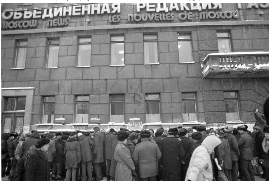
Один из стихийных диспутов у стен редакции газеты „Московские новости“ на Пушкинской. Свобода слова

Вдруг разрешили открывать кооперативы, а было это серьезным отступлением от завоеваний пролетарской революции 1917 года, ведь нас учили: частная собственность – основа жестокой и бесчеловечной эксплуатации человека человеком. Теперь частную собственность узаконили. Первый кооператив – ресторан «Кропоткинская, 36» – в американском Белом доме называли «капитализм на Кропоткинской».