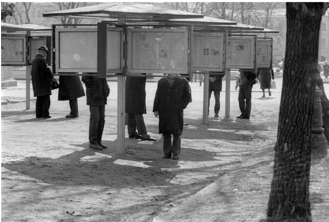
Гласность: жажда правды у газетных стендов на Чистых прудах