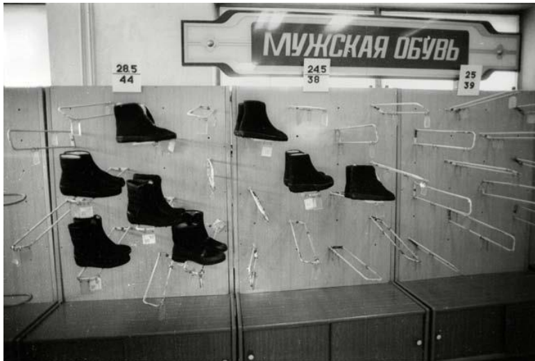
Отдел мужской обуви в советском магазине