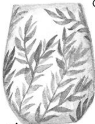
Мятный чай с медом