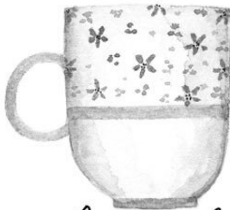
«Английский завтрак» с капелькой молока