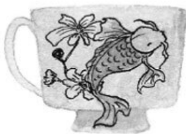
«Ассам» со сливками и сахаром