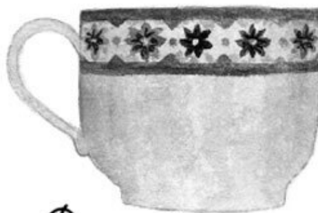
«Дарджилинг» с лимоном

Мистер Рид удивленно вскинул брови, и впервые с тех пор, как я вошла в кабинет, его взгляд приподнялся над оправой очков, когда он посмотрел прямо на меня.