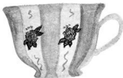
«Эрл Грей» с капелькой молока и сахаром