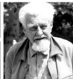
Konrad Lorenz 1903 - 1989

С появлением уникального человеческого мышления «счастливая догадка отдельного человека может навсегда... увеличить запас знаний всего человечества» (К. Лоренц).