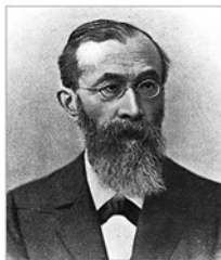
Wilhelm Maximilian Wundt 1832–1920

«Психология народов» ( Völkerpsychologie )