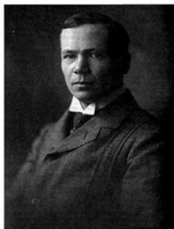
Густав Густавович Шпет 1879–1937

«...наиболее типичные «отклики» на происходящее перед их глазами, умами и сердцем... нигде так ярко не сказывается психология народа, как в его отношении к им же созданным духовным ценностям» (Шпет 1996: 111).