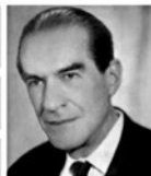
Алексей Николаевич Леонтьев 1903 - 1978

Личностные смыслы – это значения для меня, сформировавшиеся на основании личного опыта.