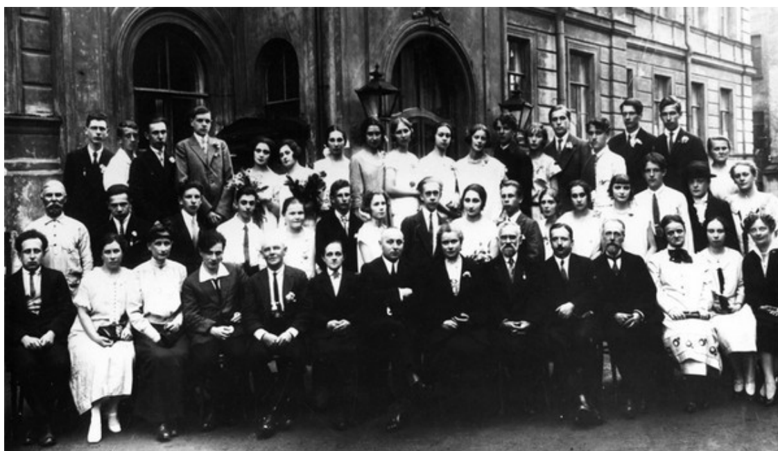
Выпускной класс Ленинградской совтрудшколы, 1926 год.

Про польские корни его я слышал, а вот про царя – крестного отца... В Новгородской губернии урожден был, кстати, и Сергей Дягилев, и тоже в семье офицера царской армии. Так он, представьте, говорил иногда, в узком кругу, что состоит в родстве с... Петром Первым. Думаю, не надо принимать всерьез эти веселые экскурсы в генеалогию.