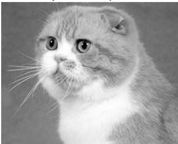
Форма головы шотландской вислоухой кошки

Недостатки: отклонения от перечисленных пунктов.