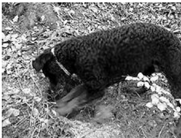
Чесапик-бей ретривер прекрасно ориентируется в лесу

Чесапик-бей ретривер находится в Соединенных Штатах Америки на особом положении. Дело в том, что именно эти собаки чаще всего используются для охоты. Они демонстрируют огромную силу, храбрость и необычайную сообразительность. Жизнерадостный и общительный характер делает чесапика прекрасным компаньоном для молодых и пожилых людей, ведущих подвижный образ жизни.