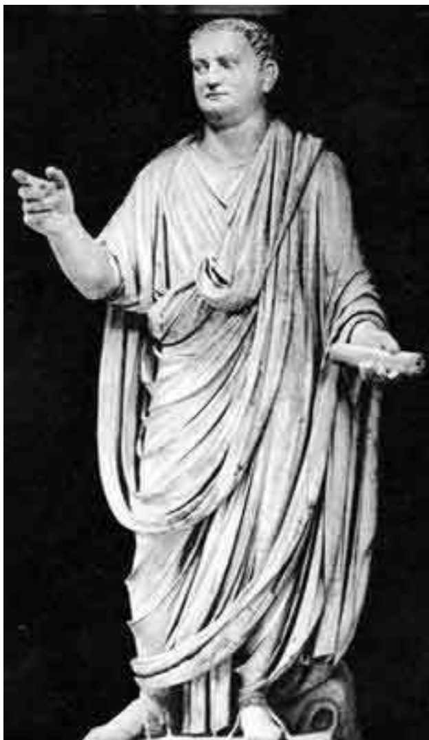
Статуя епископа Тита

дила из Греции. Никто не мог отрицать превосходства эллинского искусства, изысканность и рациональность «вражеской» одежды, оттого неудобную тогу пришлось надеть символическими свойствами.