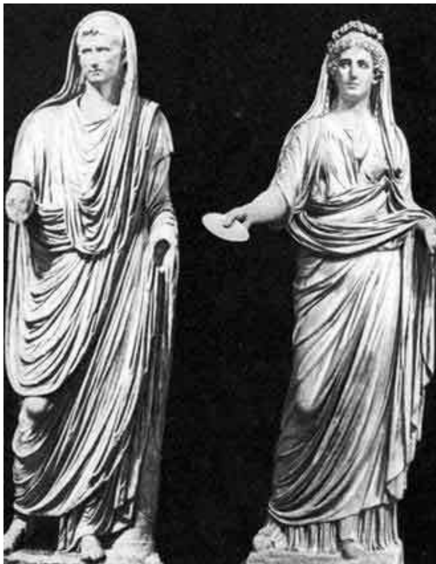
Император Август в тоге и молодая римлянка, одетая в паллу. Статуи из Национального музея Неаполя

В болезненном стремлении к величию имперские сановники сформировали особый способ ношения тоги, постепенно увеличившейся до невероятных размеров. Кусок ткани шириной 3,5 метра и длиной более 5 метров обертывался вокруг тела гораздо сложнее греческого гиматия. Сложенный в виде двух неравных овалов с продольной складкой, он оставлялся на ночь в деревянных зажимах, с тем чтобы сформовалась предписанная драпировка. При облачении один конец снабжался свинцовым грузом и перекидывался через левое плечо вперед, спускаясь до пола. Остальной материал полностью закрывал фигуру сзади. Второй конец пропускался под правой рукой, направлялся вперед наискосок по груди и перебрасывался через левое плечо, оставляя свободной только одну руку.