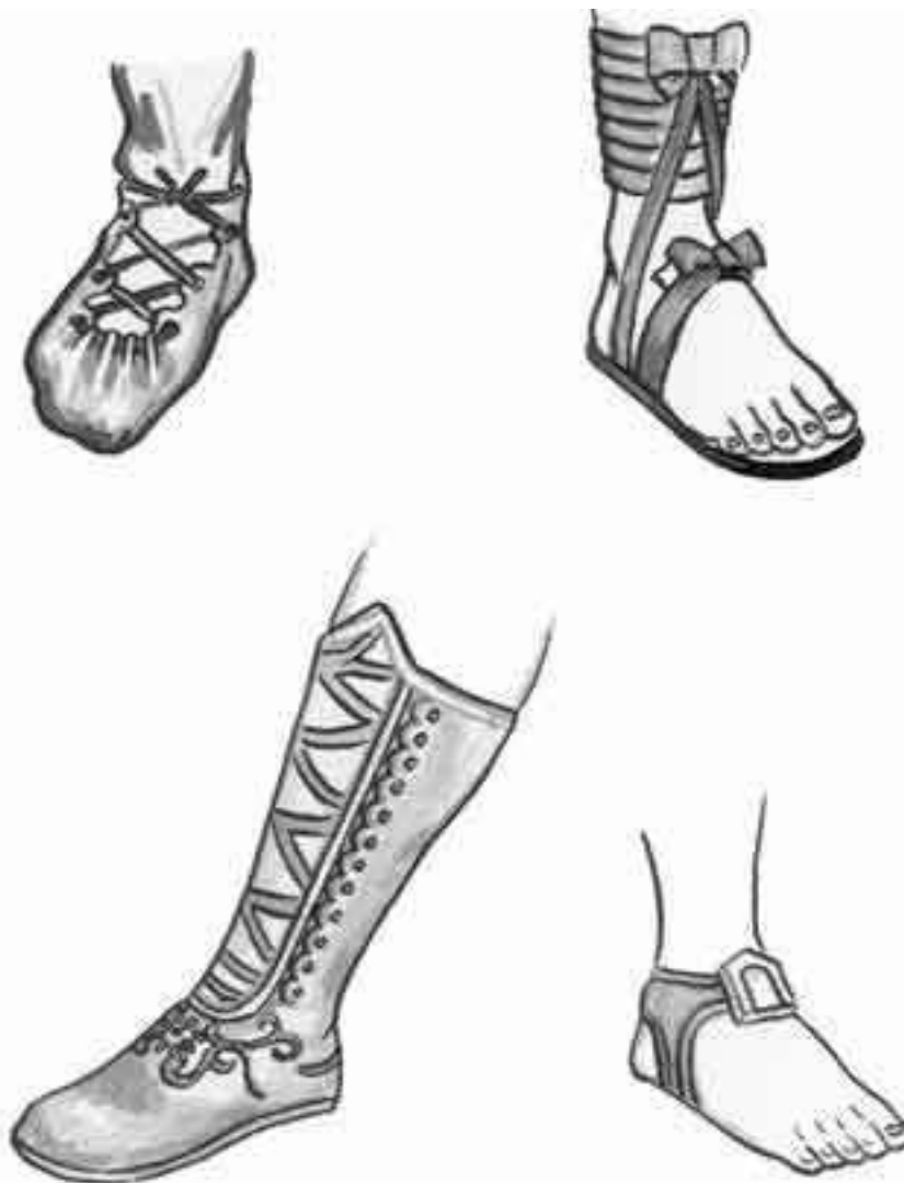
Римская обувь: а – карбатин; б – calceus – сандалии республиканской эпохи; в – сапог периода империи; г – коптские сандалии

Ранняя обувь римлян лишь выполняла свое предназначение и еще не удостоверяла статуса человека. Сандалии не украшались и полностью обнажали ногу. Позже появилось множество ремешков, стали закрываться пальцы, чем, собственно, обувь римлян отличалась от греческой. Самым простым и наиболее распространенным видом античной обуви был карбатин – кусок сыромятной кожи, вырезанный в форме подошвы, крепившийся к щиколотке шнурками. В республиканский период сановники носили сандалии solea, представлявшие собой подошву, привязанную к ноге узкой тесемкой.