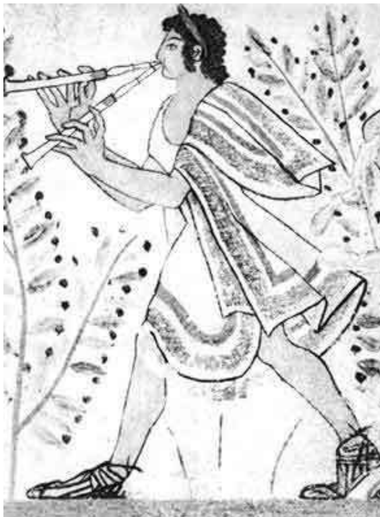
Этрусский музыкант. Фрагмент росписи склепа, 470 год до н. э.

Воздействие иноземных обычаев особенно проявилось в период империи, когда римляне уже не демонстрировали национальной скромности. Судя по фрескам из Помпей, в моде того времени царили цвет, роскошь, элегантность, что повторяло метаморфозу, произошедшую с греками в пору царствования Александра Македонского. К концу I века, когда совершенно забылся этрусский язык, Этрурия прекратила существование как государство. Однако древняя культура продолжала жить в искусстве и религиозных традициях римлян. Римляне переняли от предков гидротехнические и архитектурные секреты, способы гадания, искусство реалистического портрета и многие детали одежды. Культура Рима республиканского периода началась с изгнания этрусских царей в конце IV века до н. э. С того времени римское общество объявило себя сильнейшей державой Средиземноморья, свободной от всякого чужеземного влияния. Горделивое звание Roma togata («Рим, носящий тогу») выделяло граждан новой республики среди всех соседних народов.