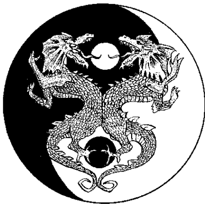
Рис. 2. Схема монады

белого цвета. Черный цвет символизирует инь, белый – ян. В центре белой капли помещена черная точка, а в черной – белая (рис. 2).