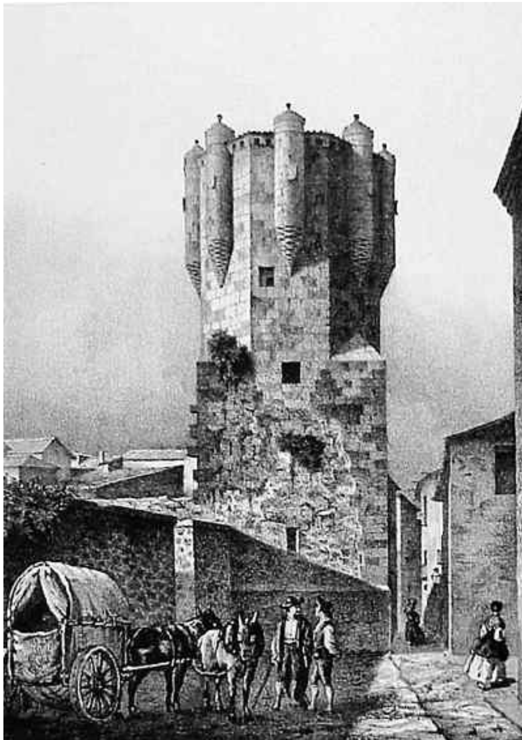
Сторожевая башня Клаверо. Гравюра, XIX век

Относившаяся к Испании борьба между Карфагеном и Римом вошла в историю под названием Второй Пунической войны. Сражения на землях иберов начались в 218 году до н. э. и продолжались около 20 лет. Военная удача обратилась в сторону римлян с момента, когда войска возглавил Публий Корнелий Сципион – смелый и решительный полководец, по таланту равный Ганнибалу, но имевший более организованную армию. Боевые действия проходили практически на всей территории полуострова, битвы следовали одна за другой, обе стороны сражались упорно, энергично, с поразительным искусством, невольно предоставив потомкам