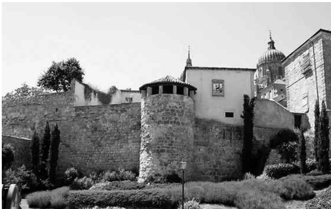
Остатки древней крепости Саламанки

Сохраняя дружеские отношения с греками, иберы оказали резкое сопротивление карфагенянам. Особые затруднения захватчики испытали в III веке до н. э., когда вместо дипломатичного Гаструбала наместником в Испании стал непримиримый Ганнибал. Будучи сторонником жестких мер, великий полководец отвергал переговоры и подавлял восстания с помощью «наводящих ужас приступов», как охарактеризовал его тактику греческий историк Полибий. До того племени внутренней Иберии не знали чужеземного ига, поэтому карфагенским солдатам пришлось столкнуться с неукротимой энергией местных воинов, сражавшихся за свободу так же упорно, как захватчики утверждали свои права.