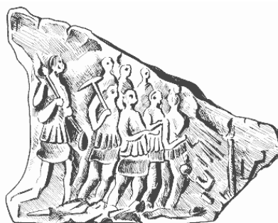
Рудокопы. Рельефное изображение на камне

В середине II века н. э. римляне стали полноправными владельцами Саламанки, где начали работать учреждения, сходные с римскими муниципалитетами; город управлялся по римским законам и все его постройки соответствовали античному стилю. Провинция была богата металлами и зерном, то есть тем, ради чего римляне пришли на иберийскую землю. Общины, добровольно покорившиеся Риму, утратили права на свое имущество, которое теперь рассматривалось как собственность империи. Размер подати устанавливался законом, но квесторы, видимо, забирали больше, вызывая тем недовольство местных.