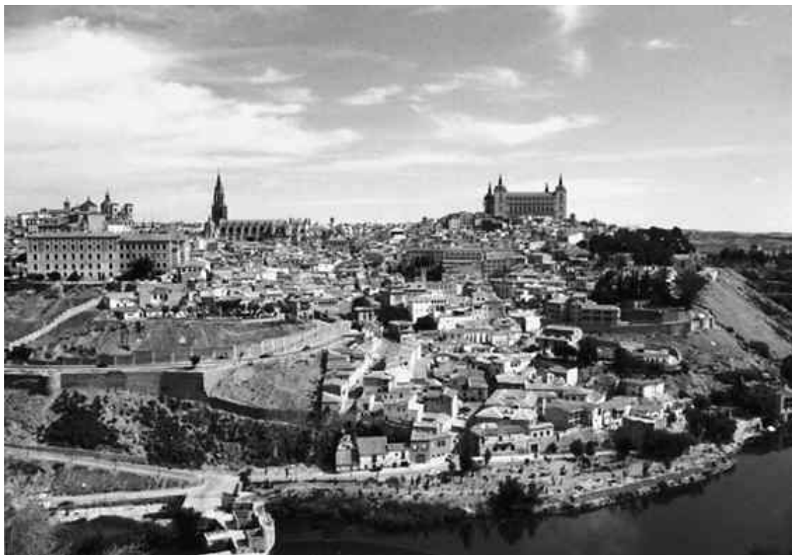
Саламанка в начале XX века

Около 2300 лет назад на месте Саламанки существовало некое подобие города. Расположенный в центре Иберийского (ныне Пиренейского) полуострова, он, к огорчению позднейших обитателей, не омывался волнами океана. Единственной водной артерией ему служила река Тормес – широкий, но не слишком бурный поток, в настоящее время перегороженный двумя мостами: изящно вытянутым Новым и массивным Римским. Асфальтовые дорожки набережной, клумбы, урны, скамейки придают ей живописный, хотя и банальный вид. Однако присутий Саламанке дух седой старины можно почувствовать у самой воды, где царит первобытная природа: буйная, на первый взгляд не тронутая человеческой рукой растительность пробивается между светло-коричневыми камнями, обильно разбросанными по берегам реки.