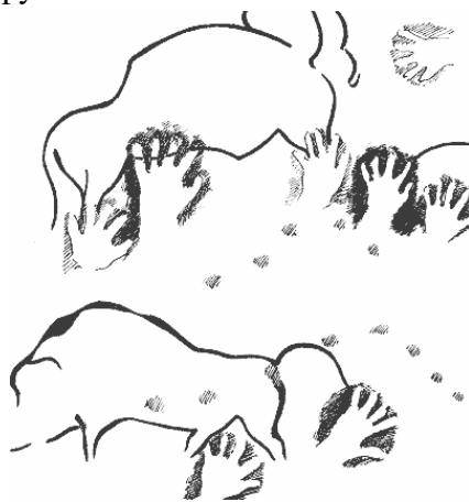
Силуэты рук и очертания бизона в наскальной живописи. С рисунка в гроте Дель Кастильо

Несмотря на мелкие недостатки, эти суровые края всегда привлекали захватчиков, искавших здесь не плодородные земли, а материальные богатства. Горные хребты, преграждавшие древним племенам выход к морю, таили в себе железо, медь, олово, свинец, ртуть, серебро, золото, которые первыми обнаружили кельты.