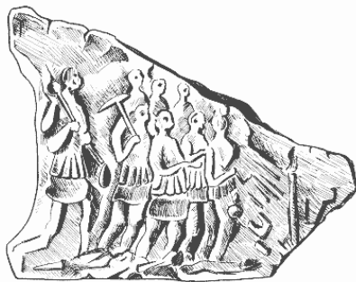
Рудокопы. Рельефное изображение на камне

В середине II века н. э. римляне стали полноправными владельцами Саламанки, где начали работать учреждения, сходные с римскими муниципалитетами; город управлялся по римским законам и все его постройки соответствовали античному стилю. Провинция была богата металлами и зерном, то есть тем, ради чего римляне пришли на иберийскую землю. Общины, добровольно покорившиеся Риму, утратили права на свое имущество, которое теперь рассматривалось как собственность империи. Размер подати устанавливался законом, но квесторы, видимо, забирали больше, вызывая тем недовольство местных.