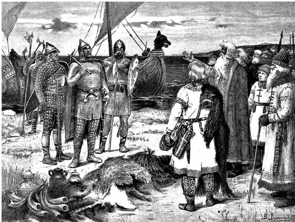
Призвание варягов. Художник В. М. Васнецов

Примитивами были не наши предки, а наши историки, которые не знали достаточно хорошо значение древних русских слов и не вдумывались в реальность минувшего. Нашу историю начали писать немцы, которые даже вообще не знали или плохо знали русский язык. А за ними, как за непререкаемыми авторитетами, пошло и пошло: «порядка в ней нет».