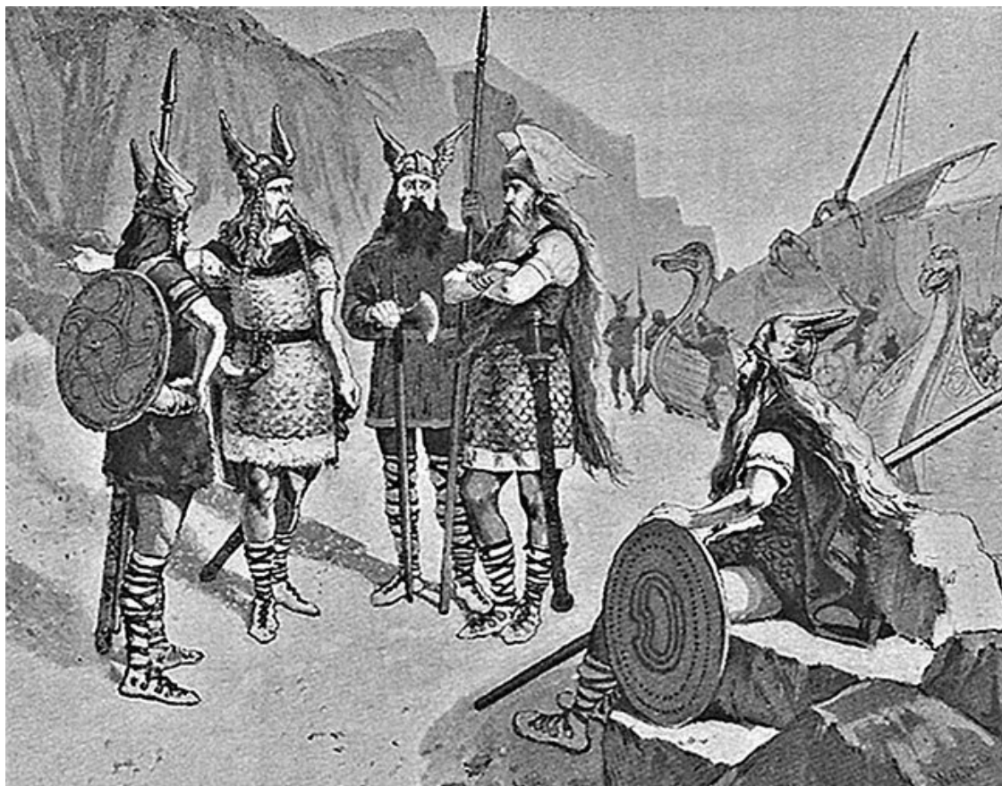
Варяги. Неизвестный художник

Под 1043 годом находим: «Рекоша Русь Володимеру (сыну Ярослава. — С.Л.): “станем zde, на поле”, а Варязи рекоша: “пойдем под град”. И послуша Володимер варяг». И отсюда вытекает, что Русь и варяги — совершенно различны. И это различие осуществлялось, начиная с Олега, который впервые столкнулся с Киевской Русью, и кончая Ярославом Мудрым (ум. в 1054 г.), когда самое имя варягов вовсе сходит со страниц русских летописей.