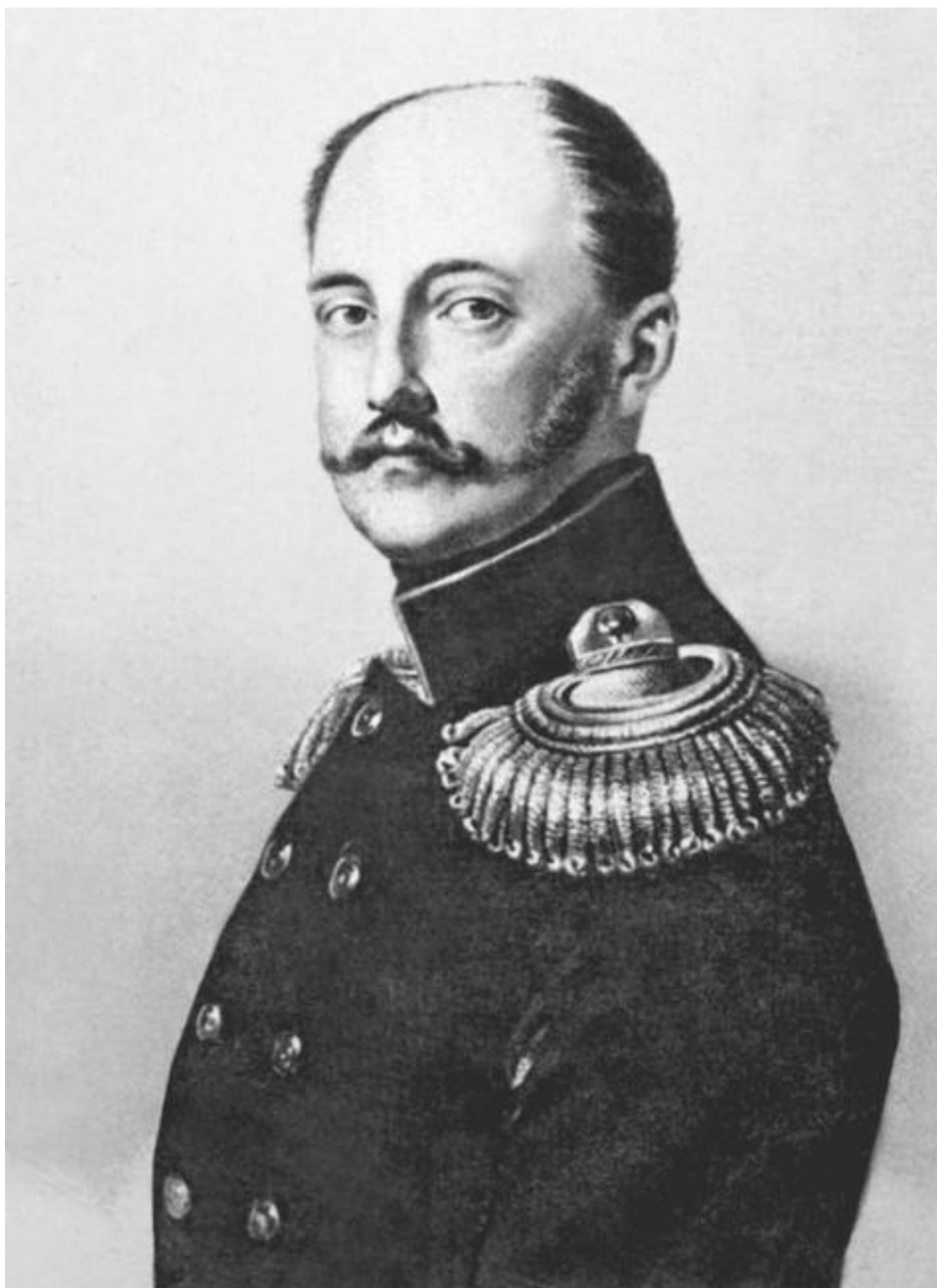
Николай I, император России (1796–1855).