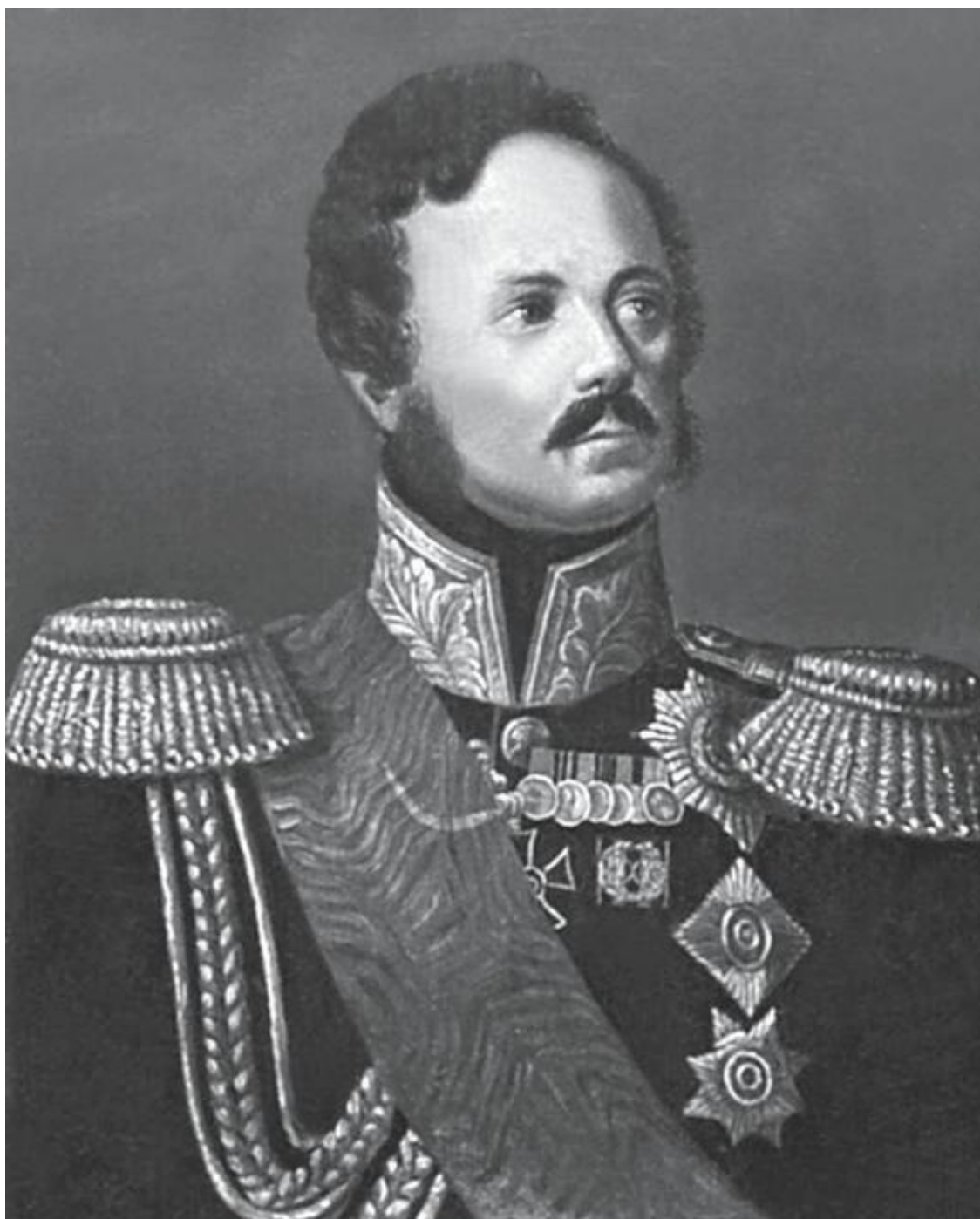
Генерал-фельдмаршал И.Ф. Паскевич (1782–1856)