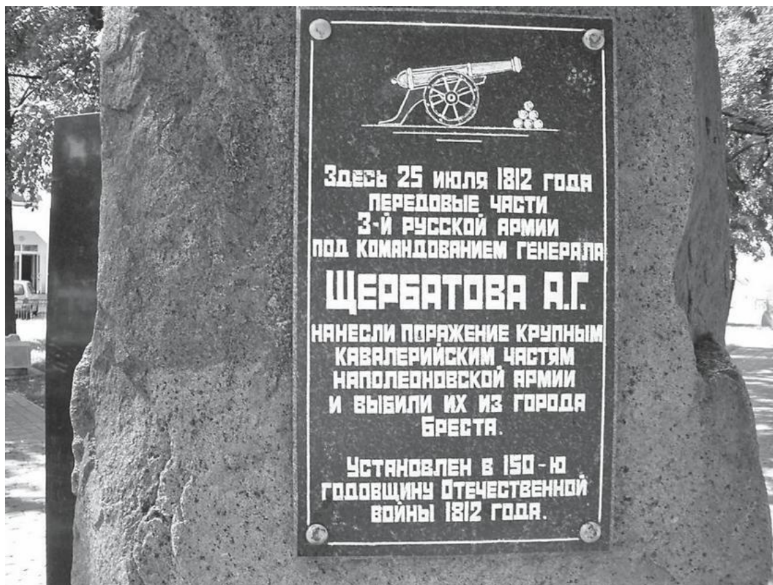
Памятный знак, посвященный 150-летию Отечественной войны.

В обмен на обещание возродить Великое княжество Литовское Наполеон потребовал призыва в свою армию 100 тысяч человек, огромных поставок фуража и продовольствия. Начались бесконечные реквизиции, которые быстро переросли в обыкновенный грабеж, вынудивший крестьян взяться за косы и топоры. Надежды на освобождение обернулись уничтожением городов и сел, разрушением хозяйства, голодом и смертью. В Гродненской губернии погибли более 37 тысяч мужчин, в том числе 4253 в Брестском повете. Тем не менее после отступления Наполеона из Москвы возвращения русских в Беларусь ожидали со страхом. Чтобы предупредить бегство населения из западных губерний, фельдмаршал М.И. Кутузов 9 ноября издал приказ, в котором говорилось: «Вступая с армией в Беларусь, в тот край, где при нашествии неприятеля некоторые из неблагонамеренных, пользуясь бывшими замешательствами, старались разными лживыми уверениями ввести в заблуждение мирных поселян и отклонить их от священных и присягою запечатленных обязанностей законному их Государю, я нахожу нужным всем армиям, мною предводительствуемым, строжайше воспретить всякий дух мщения и нарекания в чем-либо жителям белорусским, тем паче причинения им обид и притеснений». Месяц спустя последовал царский манифест о «всеобщем прощении».