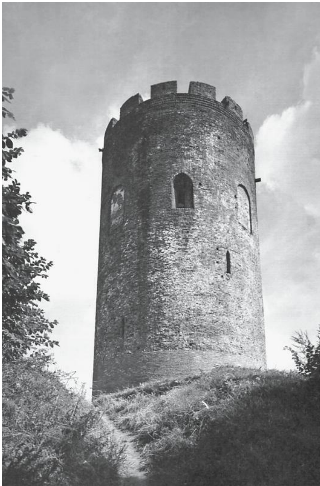
Башня-донжон в Каменце. XIII в.

К началу XIV в. Русь, раздираемая междоусобицей, раскололась на отдельные княжества, непрерывно воюющие друг с другом. В 1319 г. князь Гедимин присоединил Берестейскую