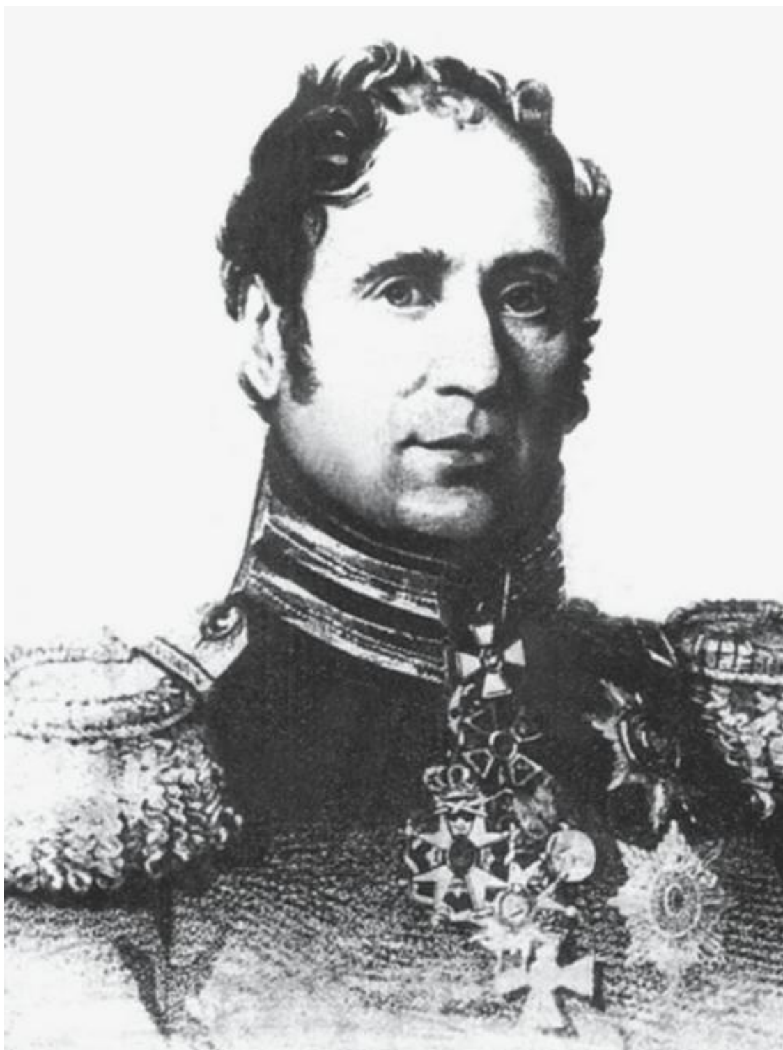
Генерал К.И. Опперман, один из авторов проекта крепости.

В 1803 г. генералу Сухтелену, возглавившему особую Инженерную экспедицию, было поручено произвести осмотр западных губерний. Тогда же Военное Министерство согласилось с его точкой зрения на необходимость укрепления западной границы империи. Подготовка экспедиции растянулась на год, а разразившаяся война с Наполеоном 1805–1807 гг. привела к новой отсрочке. Наконец осенью 1807 г. Сухтелен совершил объезд присоединенных территорий. В своем докладе он особо подчеркнул стратегически важное положение Брест-Литовска и необходимость строительства здесь крепости как опорного пункта действующей армии.