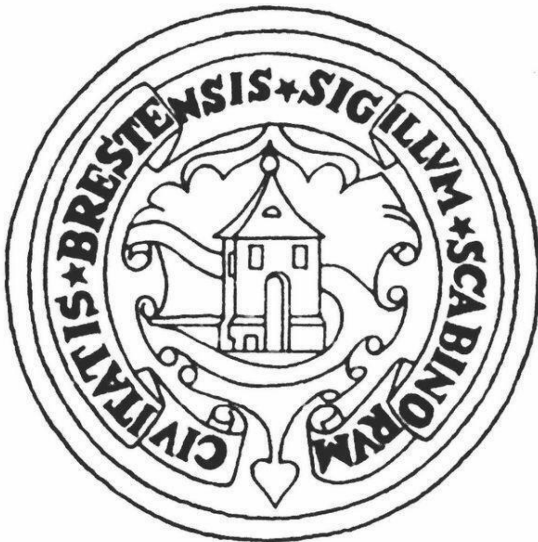
Городской герб на печати 1592–1651 гг.

В 1569 г. после подписания Люблинской унии город вошел в состав Речи Посполитой, объединившей Польшу и Великое княжество Литовское, и был переименован в Брест-Литовск. В октябре 1596 г. в Бресте состоялся собор, утвердивший объединение (унию) католической и православной церквей под эгидой Ватикана. Это было время расцвета польско-литовского государства. За сто лет мирной жизни население города увеличилось вдвое и к середине XVII в. превышало 10 тысяч человек. Затем времена изменились.