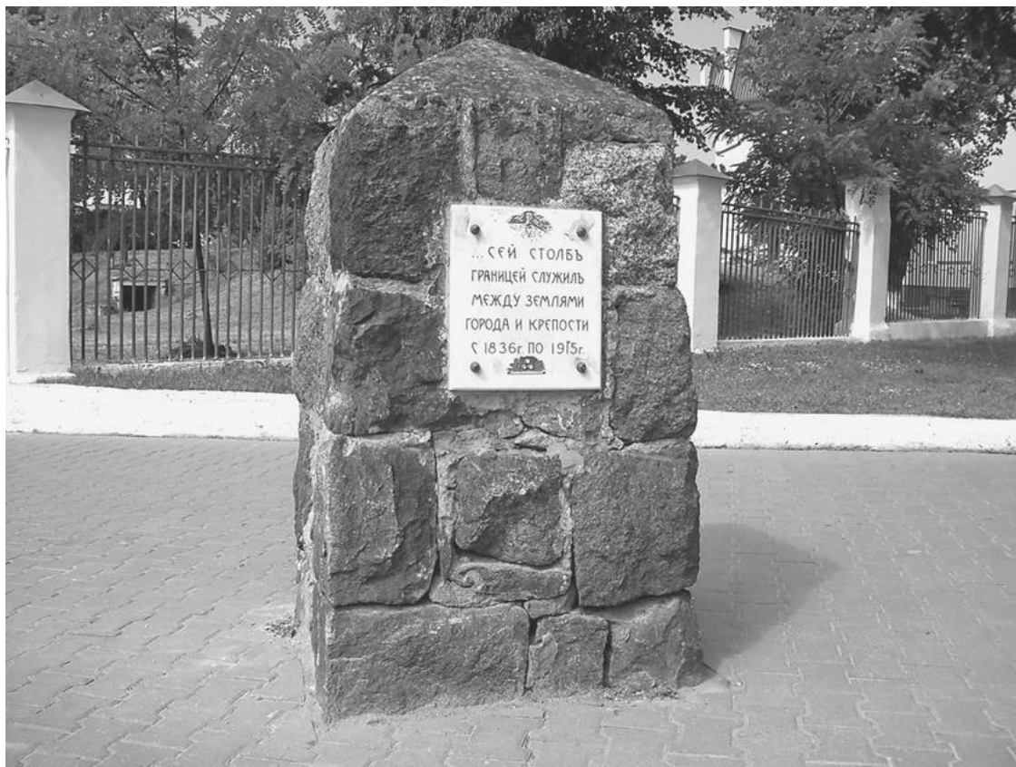
Межевой знак между землями города и крепости

– Нет, из чистого золота, по крайней мере я так за него платил.